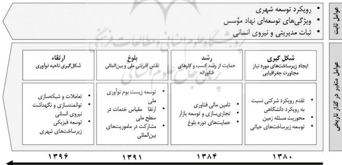
شکل ۲: الگوی پیشنهادی برای شکل‌گیری ناحیه نوآوری با محوریت پارک علم و فناوری

خروج فعالیت پارک از محدوده جغرافیایی اگرچه با برنامه‌های ملی و بین‌المللی آغاز شد، در عمل توسعه برند پارک در خارج از جغرافیای آن با توسعه شعبه‌های آن عملیاتی شد. ۱ توسعه تعاملات، برنامه‌ها، شعب و شبکه افراد باعث شد اجزای ناحیه نوآوری به صورت توسعه جغرافیایی مورد توجه قرار گیرد. به گفته مصاحبه‌شونده: «برای ماندگاری افراد باید مشکل مسکن، برای افزایش نیروی انسانی باید مسئله دانشگاه و برای کیفی‌سازی باید برنامه توانمندسازی را دنبال می‌کردیم. لذا ضمن افزایش اراضی پارک، برداشتن دیوارها با دانشگاه آزاد و همکاری با شهر پردیس برای توسعه منطقه مسکونی پارک و بهره‌مندی افراد شهر پردیس از زیرساخت‌های رفاهی پارک را دنبال می‌کردیم. توسعه ابزارها در مقیاس ملی و بین‌المللی باعث شده بود امکان خدمات‌دهی به مجموعه‌های بیشتری از شرکت‌ها فراهم شود و توسعه شبکه تعاملات باعث افزایش اعتبار پارک و تقاضای بیشتر شرکت‌ها برای استقرار در آن شده بود. از سوی دیگر امکانات دسترسی بزرگراهی و زیرساخت‌های شهری نیز موانع گسترش جغرافیایی محدوده پارک را تا حد بسیاری مرتفع ساخته بودند».