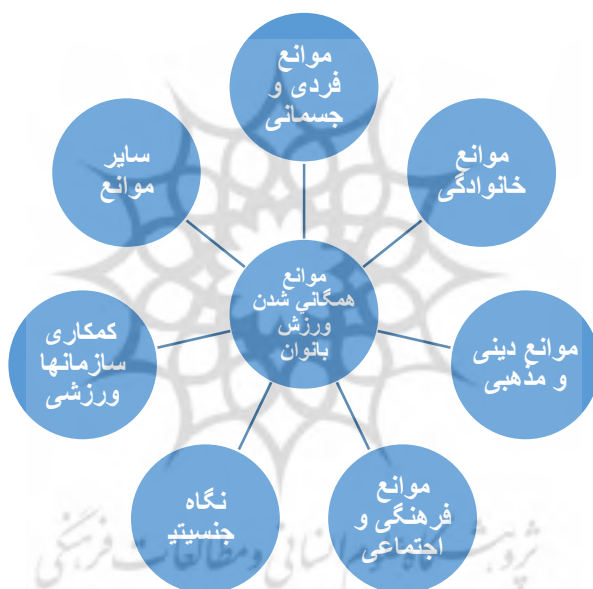
شکل ۲- مدل مفهومی موانع همگانی شدن ورزش بانوان

خصوص ورزش بانوان به عمل نیامده است و همگان از وضعیت موجود ناراضی هستند. توزیع غیر صحیح تجهیزات و امکانات باتوجه به جمعیت هر منطقه و همچنین کمبود و ناکافی بودن منابع مالی سازمان تربیت بدنی برای ایجاد اماکن ورزشی بانوان سبب شده که این معضل کمبود مکان های ورزشی بانوان با اعتبارات فعلی حل نشود. اما نوآوری در این پژوهش ضعف برنامه ریزی جامع و صحیح؛ کمبود نیروی انسانی متخصص و عدم داشتن برنامه برای پیشرفت ورزش بانوان و عدم تصمیم گیری و برنامه ریزی برای ترغیب و تسهیل حضور حمایتگران مالی در ورزش همگانی بانوان در کنار عدم جذابیت فعالیت های برنامه ورزش همگانی و عدم توجه به ورزش های بومی و