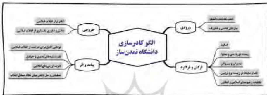
نمودار ۲. الگوی کادرسازی دانشگاه تراز انقلاب اسلامی

دانشگاه نه صرفاً غایت گرا و نه صرفاً فرایندمحور است؛ بلکه چارچوبی جامع و دربردارنده فرایندی مؤثر ضمن توجه به تحقق غایت و هدف این الگو است. در مجموع الگوی کادرسازی دانشگاه تراز انقلاب اسلامی مطابق شکل زیر است: