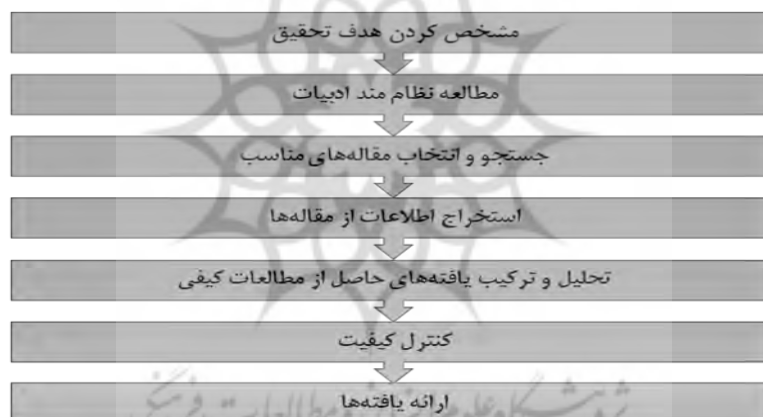
شکل ۱ - مراحل روش فراترکیب

در گام اول اجرای تحقیق با روش فراترکیب، نیاز است تا هدف اصلی پژوهش آشکار گردد.