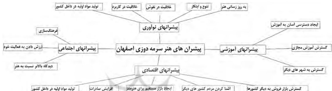
نمودار ۳: الگوی مفهومی پیشران‌ها (نگارندگان)

در این مرحله از پژوهش، ابتدا عوامل بحرانی موجود در شرایط این هنر برای شناسایی پیشران‌ها بررسی می‌شوند. از جمله عوامل بحرانی در زمینه پیشرفت هنر سرمایه‌داری می‌توان به مشکلات اقتصادی، تحریم‌ها، واردات مواد اولیه، عدم حمایت از هنرمند، عدم حمایت دولتی و عدم شناسایی هنر برای بازارهای خارجی اشاره کرد. از پیشران‌های اقتصادی در پیشرفت آینده هنر سرمایه‌داری می‌توان ایجاد بازار مستقیم فروش برای هنرمندان، آشنا کردن و شناساندن هنر سرمایه‌داری به فرهنگ‌های دیگر، ایجاد بازار صادرات و توانمندسازی بخش خصوصی را نام برد. همچنین پیشران‌های بخش اجتماعی و آموزشی را می‌توان در عوامل زیر خلاصه نمود: فرهنگ‌سازی و ایجاد دید بهتر به هنرمندان، گسترش آموزشگاه‌ها در شهرهای دیگر، ایجاد آموزش مجازی، سهولت دسترسی علاقه‌مندان به آموزش‌ها. با ایجاد نوآوری‌هایی در هنر سرمایه‌داری، می‌توان آینده این هنر را بهبود بخشید. به‌روز رسانی هنر، تنوع و ابتکار، خلاقیت در نقوش، خلاقیت در کاربرد، تولید مواد اولیه در داخل کشور، می‌توانند پیشران‌هایی در زمینه نوآوری در این هنر باشند (نمودار ۳).