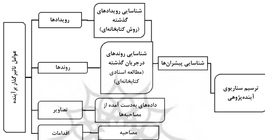
نمودار ۱: الگوی مفهومی فرایند انجام پژوهش (نگارندگان)

برای تحلیل داده‌ها در این نوع مصاحبه از تحلیل مضمون مصاحبه‌ها استفاده می‌شود. پس از انجام هر مصاحبه، نکات و مضامین کلیدی هر مصاحبه استخراج می‌شوند. برای تحلیل محتوا در این پژوهش از نرم‌افزار تحلیل کیفی محتوا (مکس کیودا) استفاده شده‌است. مضامین استخراج‌شده از مصاحبه‌ها مجموعه‌ای از مفاهیم را شکل داده و سپس مقوله‌ها از این مفاهیم استخراج و با توجه به این مقوله‌ها سناریوهای آینده‌پژوهی تدوین خواهند شد. نمونه‌گیری و انتخاب مصاحبه‌شوندگان به صورت هدف‌مند و بر مبنای شیوه گلوله‌برفی انجام شده‌است. در این شیوه از افراد متخصص در حوزه رودزی‌های سنتی از جمله سرمایه‌داری درخواست شد تا پس از پاسخگویی به سؤالات مصاحبه، افراد مرتبط با موضوع پژوهش را برای مصاحبه بعدی معرفی کنند. تعداد نمونه‌ها شامل ۲۰ نفر در گروه‌های صاحب‌نظران (کارشناسان صنایع دستی)، هنرمندان (دوزندگان رودزی‌های سنتی)، فروشندگان (تجار بین‌المللی و فروشندگان محلی) و مصرف‌کنندگان می‌شود (جدول ۱) که بر اساس اشباع نظری تعیین شده‌اند. فرایند انجام این پژوهش که با استفاده از تحلیل روندها، رویدادها، تصاویر و اقدامات به شناسایی پیشران‌ها منجر خواهد شد، در قالب الگوی مفهومی نمودار (۱) ترسیم شده‌است.