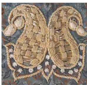
تصویر ۱: سرمه‌دوزی روی پارچه ترمه (نگارندگان)

می‌گیرند، اما بعضی دیگر صرفاً این هدف را ندارند، باین‌حال تمامی آن‌ها بر آینده اثر می‌گذارند (همان: ۲۷). پس از شناسایی این مؤلفه‌ها که با جمع‌آوری و تحلیل داده‌ها صورت می‌گیرد، پیش‌ران‌های موردنیاز برای آینده شناسایی شده و پس از آن سناریوهایی برای آینده که با توجه به تحلیل وضعیت فعلی ممکن است رخ دهند، تنظیم می‌شوند.