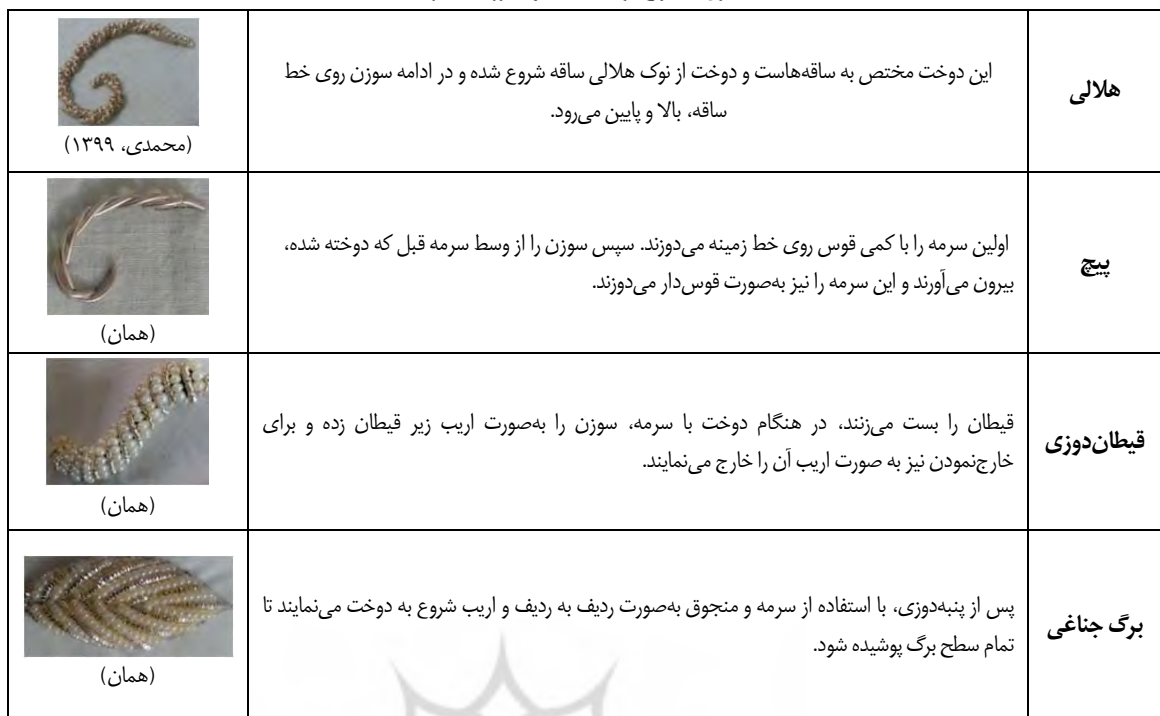
جدول ۳: انواع دوخت‌های سرمه‌دوزی (نگارندگان)