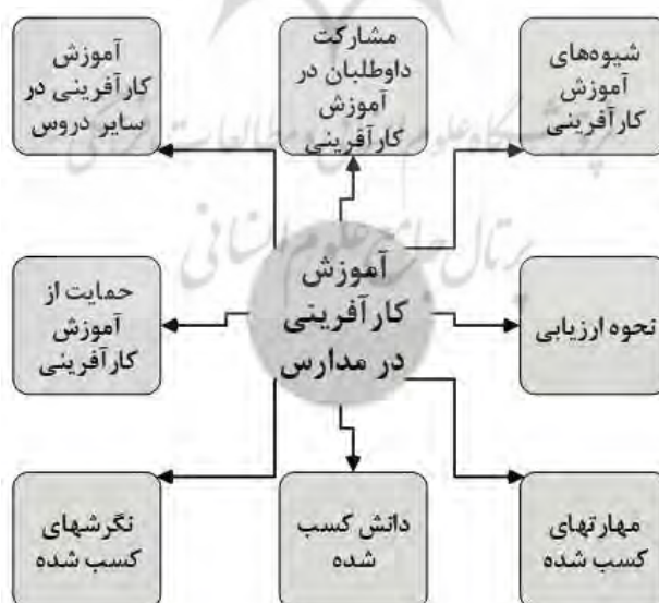
شکل ۲- چهارچوب مفهومی اولیه برای آموزش کارآفرینی در مدارس

در شکل (۲) چهارچوب مفهومی اولیه به‌دست آمده برای آموزش کارآفرینی در مدارس ترسیم شده است.