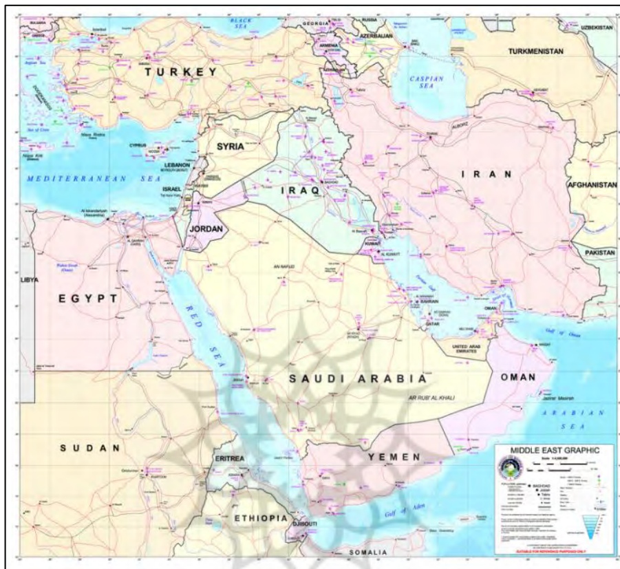
تصویر ۱. نقشه منطقه غرب آسیا (خاورمیانه)

به اعتقاد بسیاری از اندیشمندان، در میان مناطق ژئوپلیتیکی که نقش و جایگاه آن در عرصه نظام بین‌المللی ارتقا یافته، قسمت جنوب غربی آسیا و به‌ویژه منطقه خاورمیانه می‌باشد (اخباری و ایازی، ۱۳۸۶: ۳۷). این منطقه ۸۵ درصد مسلمانان جهان و بیش از ۶۵ درصد منابع نفتی و گازی دنیا (جدای از منابع زمینی و طبیعی دیگر) را دربرمی‌گیرد و به‌دلیل وجود مؤلفه‌هایی مانند تنوع و گستردگی قومی - مذهبی، اختلافات مرزی، حکومت‌هایی با اشکال مختلف و استقرار رژیم صهیونیستی در این منطقه، به یک کانون بحرانی در جهان تبدیل شده است (بیگدلی، ۱۳۸۵: ۶۲). هم‌چنین، این منطقه نقش مهمی در نظام دینی و عقیدتی جهان دارد و ادیان آسمانی یهودیت،