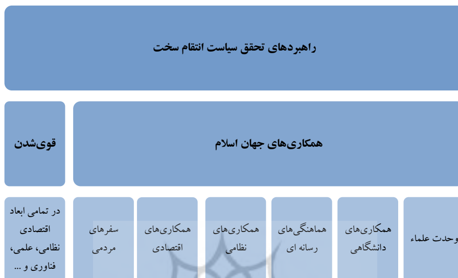
شکل ۶. راهبردهای اصلی و فرعی تحقق سیاست انتقام سخت مبتنی بر بیانات رهبر معظم انقلاب اسلامی