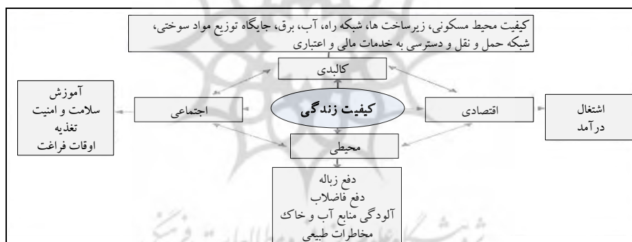
شکل ۱. مدل مفهومی کیفیت زندگی (Ventogo, 2003: 1030)

محققان حوزه کیفیت زندگی با چهار مسئله روبرو هستند، ابتدا با چه روشی به اندازه‌گیری کیفیت زندگی در افراد بپردازند، دوم این که کدام ابعاد وجودی انسان در اندازه‌گیری مورد استفاده قرار بگیرد، سوم چگونه اندازه‌گیری برای افراد و گروه‌های مختلف صورت بگیرد و چهارم چگونه نتایج ارائه شود تا اجازه مقایسه میان افراد و گروه‌ها را بدهد (Rahman et al, 2011: 147). کیفیت زندگی در ابعاد کالبدی، اقتصادی، اجتماعی و محیطی قابل سنجش و نتایج آن قابل بیان می‌باشد، با بررسی شاخص‌های مذکور می‌توان کیفیت زندگی در جوامع مختلف و انسان‌های متفاوت را سنجید.