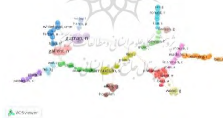
شکل ۷- شبکه‌ی هم‌نویسندگی پژوهشگران خارجی حوزه‌ی برنامه‌ریزی مسکن