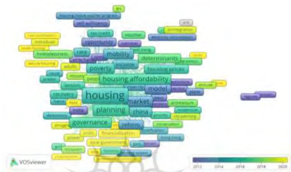
شکل ۳- موضوع‌های جدید حوزه‌ی برنامه‌ریزی مسکن

شکل شماره (۳) در واقع، روند موضوع‌ها در سال‌های مختلف را نشان می‌دهد، اینکه هر سال چه موضوع‌هایی مطرح بوده‌اند. مقاله‌های دارای سال انتشار قدیمی‌تر به رنگ آبی و مقالات دارای سال انتشار جدیدتر به رنگ‌های سبز و زرد هستند.