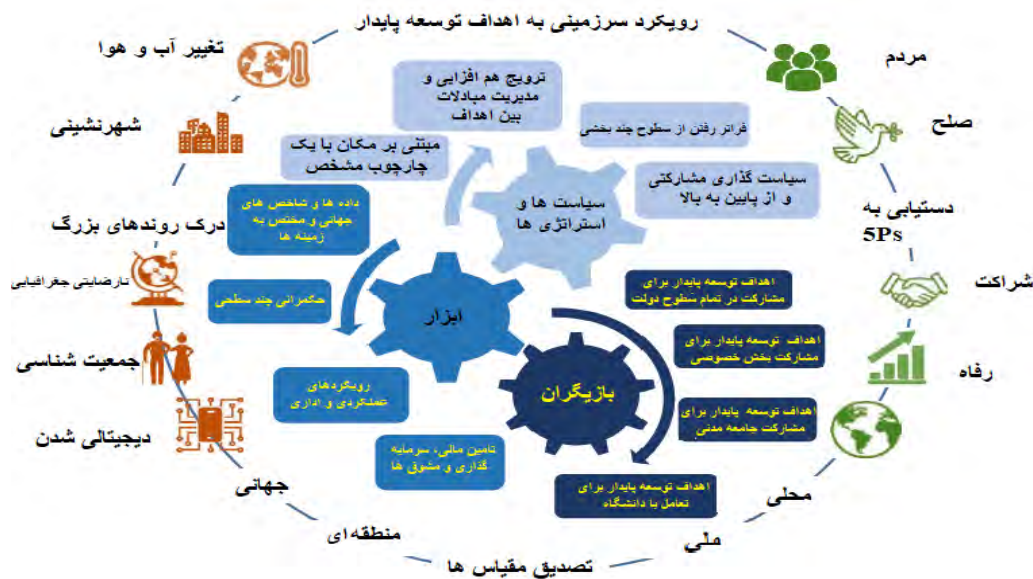
شکل ۰۱. رویکرد سرزمینی به اهداف توسعه پایدار (OECD, 2021)