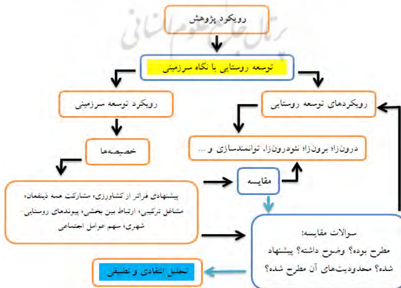
شکل ۳. رویکرد مفهومی پژوهش (نویسندگان، ۱۴۰۲)

در گام سوم، تحلیل کیفی محتوای متون به دست آمده از این منابع با هدف پاسخگویی به سؤالات ارائه شده در جدول ۳ انجام شد. در یک استدلال استقرایی، ۶ مقوله و ۲۴ سؤال برای سازماندهی تحلیل ایجاد شد. نهایتاً تحلیل انعکاسی و انتقادی از مرور پیشینه در زمینه توسعه روستایی از طریق شناسایی شکاف‌ها و سوگیری‌هایی که به صراحت در مطالعات بیان شده‌اند صورت گرفت. سپس رویکرد محوری پژوهش تبیین شد و این دو روند مقایسه و تحلیل شدند (شکل ۳).