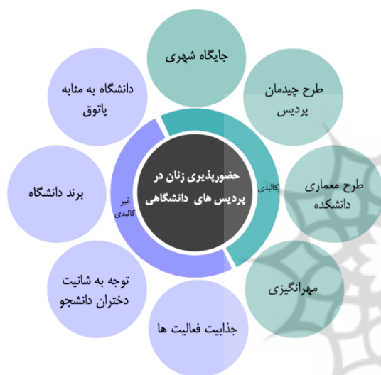
نمودار ۱: مضامین استخراج شده از تجارب فضایی دختران دانشجو از پردیس‌های دانشگاهی منتخب

کالبدی، ب-عوامل غیرکالبدی. بدین ترتیب هر دو پردیس دانشگاهی منتخب در هشت مضمون اصلی مشترک هستند؛ «جایگاه شهری»، «طرح چیدمان پردیس دانشگاهی»، «طرح معماری دانشکده»، «مهرانگیزی»، «اهمیت پاتوق‌گرایی در دانشگاه»، «توجه به شاینت و حقوق دختران دانشجو»، «برند دانشگاه» و «جذابیت فعالیت‌ها و رویدادهای دانشگاهی» (نمودار ۱). مضمون اول تا چهارم مرتبط با عوامل کالبدی، و مضمون پنجم تا هشتم اشاره به عوامل غیر کالبدی محیط دارند. هر یک از این مضمون‌های اصلی چندین مضمون فرعی را در بر می‌گیرند که در هر دو مکان مشترک هستند، اما وزن اهمیت و چگونگی آن‌ها با یکدیگر تفاوت دارد.