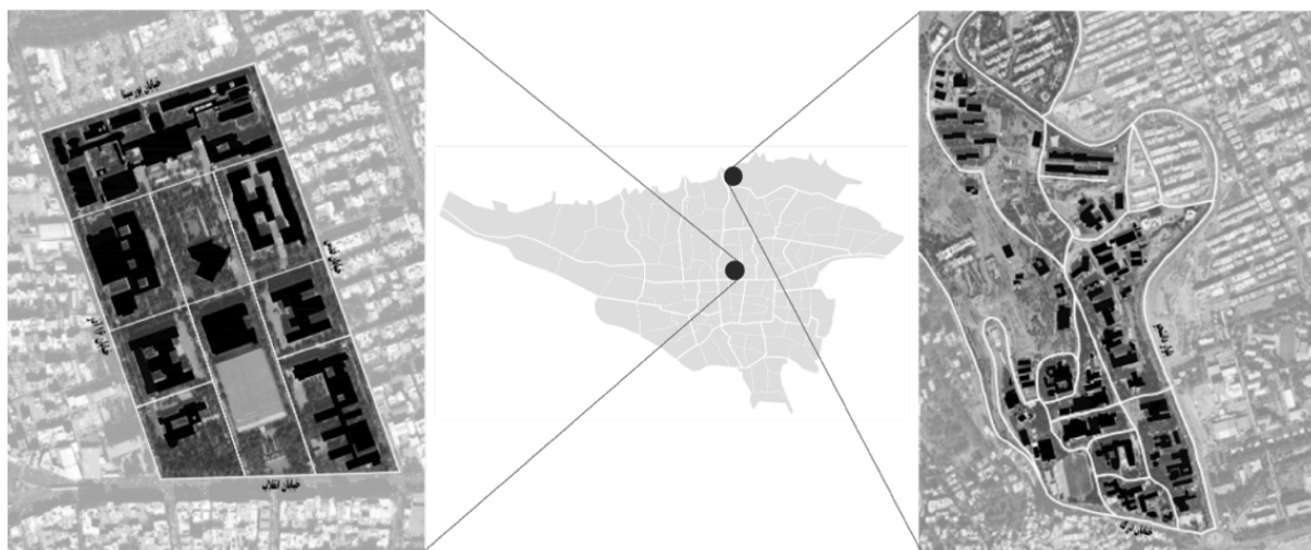
شکل ۳: موقعیت پردیس‌های دانشگاهی منتخب در شهر تهران (تصویر سمت راست: دانشگاه شهید بهشتی، تصویر سمت چپ: دانشگاه تهران)

همچنین انتخاب حداقل دو ترم متوالی به این دلیل بوده است که دانشجویان تجارب گوناگونی را در طول یکسال با وضعیت و شرایط آب و هوایی مختلف، مراسم‌های مناسبتی گوناگون داشته باشد. در مجموع ۴۰ مصاحبه شامل ۲۰ مصاحبه در دانشگاه تهران و ۲۰ مصاحبه در دانشگاه شهید بهشتی مطابق جدول ۳ انجام شد.