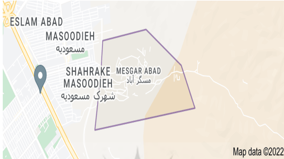
نقشه ۱. حدود محله مسگرآباد منبع: مپ دیتا (۲۰۲۲)