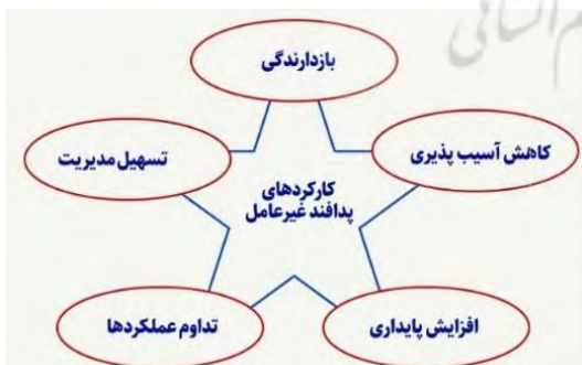
شکل ۲- کارکردهای پدافند غیرعامل