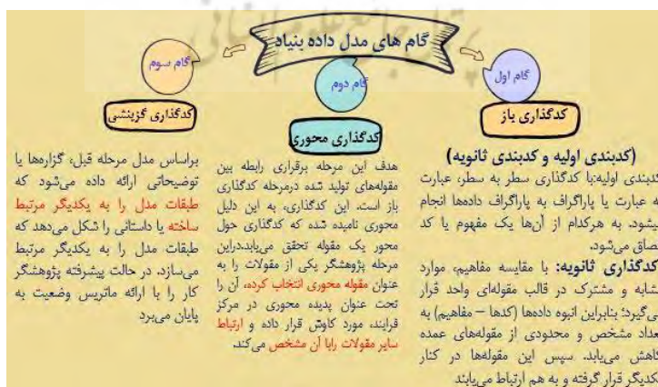
شکل ۲- تدوین الگوی انتقال تکنولوژی با رویکرد یادگیری تکنولوژیک صنعت نفت.

دسته‌ای از علت‌ها و ویژگی‌های آنها است که نقش برجسته‌ای در دستیابی به هدف الگوی یا چارچوب دارند که پس از بررسی‌های عمیق مفاهیم استخراج شده از مقوله‌های استخراج شده ۹۴ مقوله فرعی و ۲۶ مقوله اصلی شناسایی شده از ۵۳۷ مفاهیم در کل ۹۹ مفاهیم در ۱۹ مقوله فرعی و ۴ مقوله اصلی دسته‌بندی شده و همه این مفاهیم به‌عنوان علت‌های برجسته‌ای در جهت محقق شدن مقوله اصلی تدوین الگوی انتقال فناوری با رویکرد یادگیری تکنولوژیک صنعت نفت و گاز هستند. خلاصه نتایج جدول نشان می‌دهد که در شرایط علی ۹۱ تعداد از مفاهیم که شامل ۴ مقوله اصلی و ۱۹ مقوله فرعی به‌عنوان شرایط علی که مقوله‌هایی که بر علل وجودی تدوین الگوی انتقال فناوری با رویکرد یادگیری تکنولوژیک در صنعت نفت تأثیر دارند استخراج شده است.