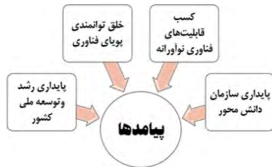
شکل ۹- پیامدهای حاصل از به‌کارگیری راهبردهای مؤثر بر مدل انتقال تکنولوژی.

ث: در پیامدها، پایداری سازمان دانش‌محور با بار عاملی ۰,۹۴ عامل کلیدی محسوب می‌شود.