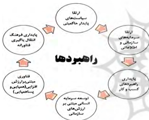
شکل ۸- راهبردهای مؤثر بر الگوی انتقال فناوری.

در این محور زمینه‌ای ۹۲ مفاهیم در ۱۹ مقوله فرعی و ۶ مقوله اصلی دسته‌بندی شده‌اند که می‌توانند به‌عنوان عواملی مؤثر بر راهبردها و اقدامات تدوین الگوی انتقال تکنولوژی با رویکرد یادگیری تکنولوژیک در صنعت نفت اثر داشته باشند و یا به عبارتی می‌تواند تسهیلگری در دستیابی به راهبردها باشند.