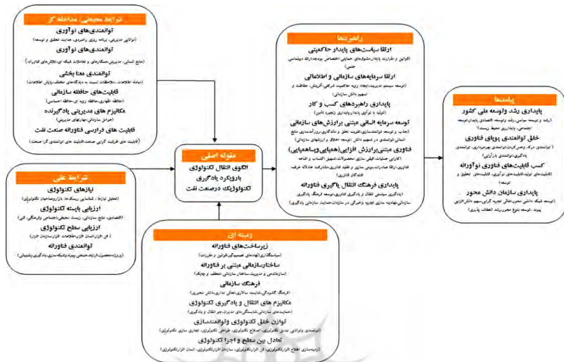
شکل (۳): مدل مفهومی انتقال تکنولوژی با رویکرد یادگیری در صنعت نفت و گاز

طرفه (پیش فرض نرمال) مقادیر بحرانی اعداد ۱,۹۶ و ۱,۹۶- هستند.