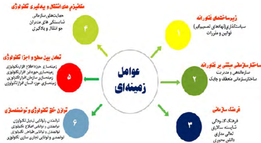
شکل ۷- عوامل زمینه‌ای مؤثر بر الگوی انتقال فناوری.

تدوین الگوی انتقال فناوری در صنعت نفت و گاز پارس جنوبی از منظر یادگیری تکنولوژیک با تأکید بر تداوم کارکرد