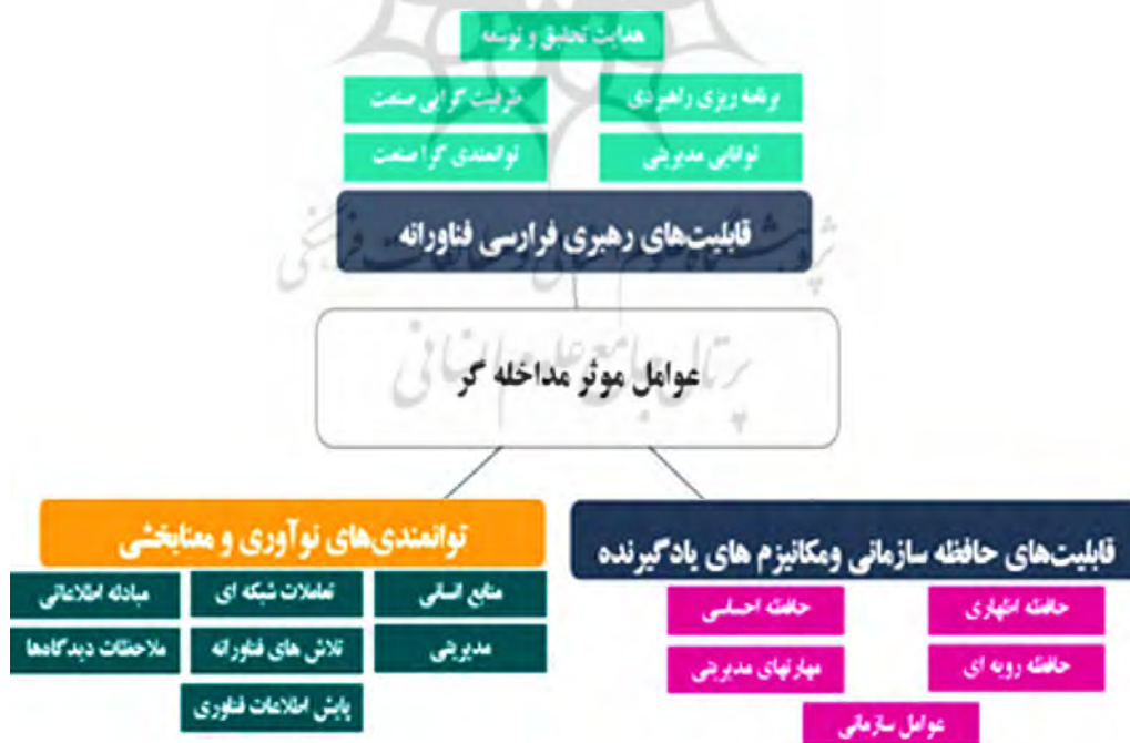
شکل ۱۰- عوامل مداخله‌گر مؤثر بر مدل انتقال تکنولوژی.

عوامل مداخله‌گر شامل سه مقوله اصلی و ۱۸ مقوله فرعی و ۹۲ مفاهیم استخراج شده و در این مرحله این عوامل به سه دسته شامل: قابلیت‌های رهبری فرارسی فناورانه، توانمندی‌های نوآوری و معنابخشی، قابلیت‌های حافظه سازمانی و مکانیسم‌های یادگیرنده صنعت نفت تقسیم شده است که به‌عنوان شرایط مداخله‌گر که بر راهبردهای مدل الگوی انتقال تکنولوژی با رویکرد یادگیری تکنولوژیک در صنعت نفت تأثیر می‌گذارند. در این پژوهش بر اساس