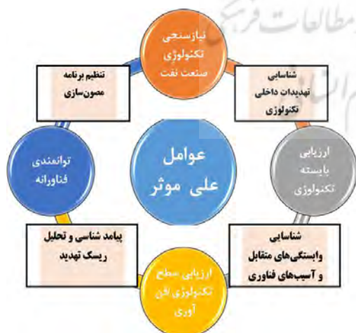
شکل ۶- عوامل علی ایمن و مؤثر بر الگوی انتقال تکنولوژی با رویکرد یادگیری تکنولوژیک صنعت نفت

فرایند علی مؤثر بر الگوی انتقال فناوری پس از بررسی‌های عمیق مفاهیم استخراج شده از مقوله‌های استخراج شده (۵۳۷ مفاهیم و ۱۴۵ اصلی و ۲۳ مقوله فرعی) ۹۱ از مفاهیم ۱۹ مقوله فرعی و ۴ مقوله اصلی دسته‌بندی شده است که عبارت است از: نیازسنجی فناوری صنعت نفت (نیازهای فناوری)، ارزیابی بایسته فناوری (انتخاب فناوری مناسب)، ارزیابی سطح فناوری و توانمندی فناورانه. با لحاظ نمودن هشت گام کلیدی تضمین تداوم کارکرد و بازیابی عملکرد زیرساخت‌های حیاتی و حساس صنعت کشور که صنایع نفت و گاز نیز جزوی از آن است، الگوی اصلاحی فرایند انتقال مؤثر فناوری با رویکرد آموزش و یادگیری عناصر و مؤلفه‌ها و شیوه‌های کاربست آن فناوری به شرح شکل (۶) پیشنهاد و استخراج گردیده است.