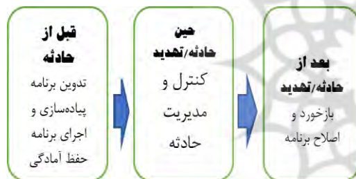
شکل ۱- فرایند طرح تداوم کارکرد و بازبینی زیرساخت.

همچنین در جدول (۲) اصول انطباقی فازهای سه‌گانه تداوم کارکرد و تجربیات جهانی انتقال تکنولوژی مورد بررسی و همپوشانی مورد نظر آن با نماد (*) مشخص شده است.