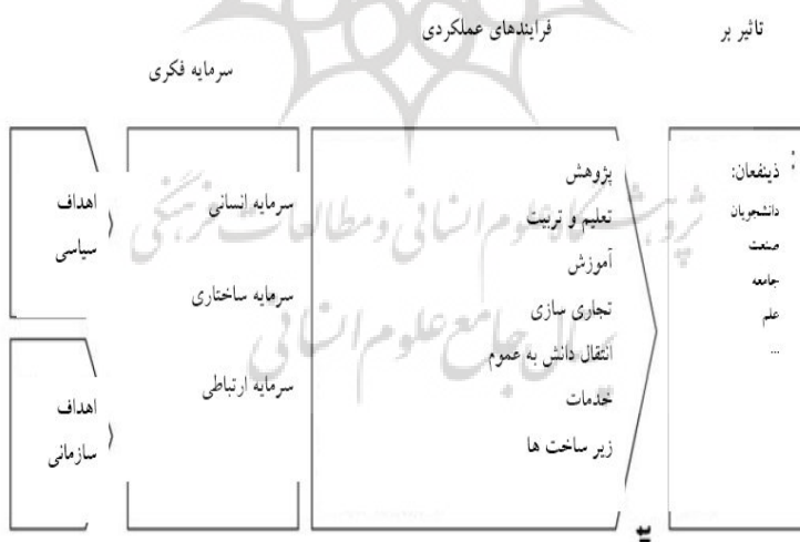
شکل ۱: مدل ارزیابی سرمایه فکری دانشگاهی لایتنر

لایتنر (۲۰۰۲) بر اساس دیدگاه سیستمی و با توجه به سه مؤلفه اصلی سرمایه فکری، مدل ارزیابی سرمایه فکری دانشگاهی را تدوین کرده است. در این مدل برای آگاهی مدیران دانشگاهی در تشخیص اینکه "چه مؤلفه‌هایی از سرمایه فکری" باید ارزیابی شود، توجه آنان را به تعیین اهداف سیاسی و سازمانی معطوف می‌دارد و سپس، با توجه به سه مؤلفه اصلی سرمایه فکری، برای ارزیابی سرمایه‌های نامحسوس دانشگاه چارچوبی ارائه می‌کند. فرایندهای عملکردی در این مدل و تأثیرات ارزیابی سرمایه فکری بر ذینفعان داخلی و خارجی دانشگاه نقش مهمی ایفا می‌کند [۱۹]. نمای کلی مدل در شکل ۱ نشان داده شده است.