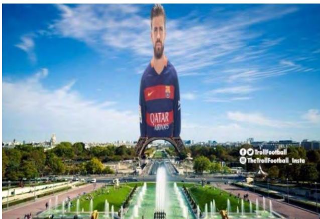
تصویر شماره (۳): تونل پیکه!