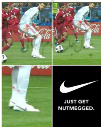
تصویر شماره (۱): نایک: فقط لایبی بخور!