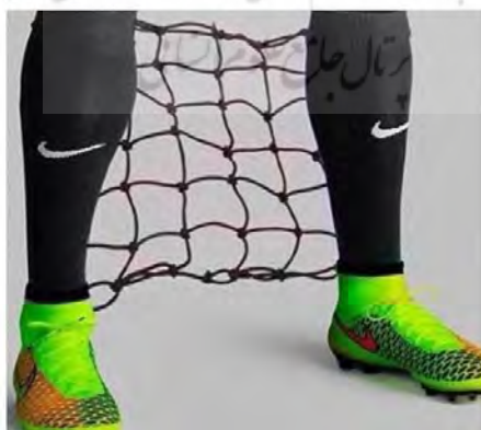
تصویر شماره (۴): نایک غیرقابل اطمینان!