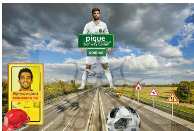
تصویر شماره (۲): تونل بزرگراه پیکه!