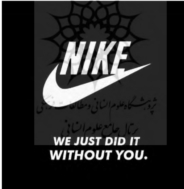
تصویر شماره (۷): بدون نایک انجامش دادم