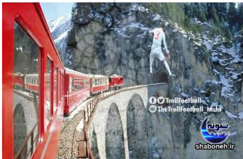
تصویر شماره (۵): تونل قطار بیکه!