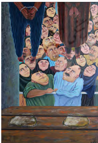
تصویر ۱. والاترین اجرای غلام و بدقم از مجموعه آدم و حوا، رنگ روغن روی بوم، ابعاد: ۷۰×۵۰.

همان‌طور که مشاهده می‌شود، در تصویر (۳) نمایی از یک کتابخانه به تصویر درآمده است. از تصویر نصب‌شده در کنار دیوار (تصویر صادق هدایت) ۳ چنین برمی‌آید که این کتابخانه متعلق به فردی اهل مطالعه و دوستدار ادبیات است. در سمت چپ پایین تصویری مردی با هیبتی آرام روی صندلی نشسته و کتاب بازی در دست دارد که نشان می‌دهد مشغول مطالعه است. اما در لحظه خلق اثر وی به روبرو می‌نگرد و از مطالعه باز می‌ماند. تمام عناصر تصویر در جایی که باید، هستند، به جز زنی که در سمت راست تصویر دیده می‌شود. وی روی کتابخانه با حرکاتی نامعلوم ایستاده و به مخاطب می‌نگرد. در مکانی که تمام عناصر در جایگاه عادی خود قرار دارند، زنی روی کتابخانه با حرکاتی نامتعارف، تعجب مخاطب را برمی‌انگیزد. استفاده از پیکره زن شاخ‌دار با قالبی عجیب در جایگاهی تعجب‌آور در کنار مردی شاخ‌دار نشسته و در حال مطالعه، سرشار از