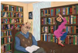
تصویر ۲. نگاه کن از روزنه فکر غلام روشنیه از مجموعه آدم و حوا، رنگ روغن روی بوم، ابعاد: ۷۰×۵۰.

انسان‌های شاخ‌دار بهره برده و هنگامی که صرفاً قصد به تصویر کشیدن صحنه‌ای را داشته، از انسان‌های معمولی یا بدون شاخ استفاده کرده است. در تصویر (۱) صحنه‌ای اعدام دو تن از اهالی یک شهر یا روستا را نمایش می‌دهد. افرادی با اشتیاق و بدون کوچک‌ترین ابراز هم‌دردی و یا ترس از دیدن این صحنه، به تماشا ایستاده‌اند. اعدام در ملأعام صورت گرفته است و از این مهم می‌توان دریافت، افرادی اعدام‌شده، مرتکب جرم سنگینی بوده‌اند. مباحث مربوط به اجرای حکم در دید عموم، ارتباط نزدیکی با مسائل اجتماعی و شاید فرهنگی دارد، چراکه مردم از دیدن این صحنه هم مراقب اعمال و رفتار خود خواهند بود و هم از اجرای قانون راضی خواهند بود. بادپر در این تصویر از انسان‌های شاخ‌دار استفاده کرده است. دلیل این استفاده بسته به موضوع اثر (اجرای قانون در ملأعام) مرتبط با مضامین فرهنگی و جامعه‌شناختی بوده و هم اینکه مردمی که به تماشا ایستاده‌اند به واسطه شاخی که دارند، مردم موجه این جامعه‌اند.