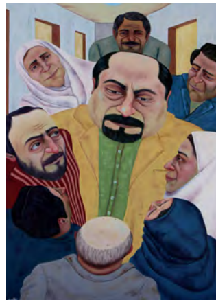
تصویر ۶. دل کارفرما از مجموعه زندگی کارگران کارخانه، رنگ روغن روی بوم، ابعاد: ۷۰ × ۱۰۰.

در تصویر (۷) نمای داخل اتوبوس را نشان می‌دهد که مسافران (کارمندان) عده‌ای خواب و عده‌ای بین خواب‌ویداری ترسیم شده‌اند. چهره‌های افراد به طرز قابل ملاحظه‌ای از حالت فرم اصلی خارج شده‌اند، به طوری که گویی هر ویژگی از چهره ایشان به طرز اغراق‌گونه‌ای مورد تحریف واقع شده است. بینی بزرگ، دهان گشاد، چشمان کشیده و غیره از ویژگی‌هایی هستند که در هنرمند در طراحی چهره‌ها بهره برده است. چهره مردی که در سمت چپ نشسته و بیدار است، از اغراق به مراتب کم‌تری نسبت به سایرین برخوردار است، او شاید مشغول تفکر پیرامون روزمرگی هر روز نشستن در این مینی‌بوس و رفتن به محل کار بوده و کسالت ناشی از آن را تحمل می‌کند. این بیان صریح می‌تواند نشانی ضمنی از این باشد، که هنرمند بی‌تفاوتی و ناآگاهی انسان‌ها را در خوابیدن و مبالغه اعضای چهره ایشان نمایانده است. به طور کلی این میحث در تمام آثار بادپر سیطره دارد که، بیان پیکره‌ها ارتباط مستقیمی با شخصیت ایشان دارد. به بیان بهتر، ناآگاهی و جهالت انسان‌ها را در تحریف اعضای چهره و پیکره آن‌ها نشان می‌دهد. و این همان بیان قالب گروتسک است که