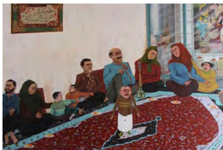
تصویر ۸. گریه آخر، رنگ روغن روی بوم، ابعاد: ۷۰ × ۱۰۰.

اما در گروتسک وضع به صورت دیگری است، اجزای چهره و پیکره انسانی کاملاً از تناسب مطرح‌شده، عدول کرده است. که در واقع همان‌طور که ذکر شد، تحریف و عدول از تناسب رایج یکی از بارزترین ویژگی‌های گروتسک است. در آثار بادپر، تحریف آشکاری در اعضای چهره و پیکره انسانی صورت گرفته که می‌توان از آن‌ها به عنوان شاخصه‌های گروتسکی این آثار نام برد.