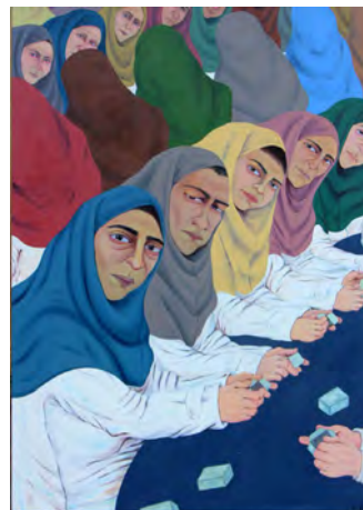
تصویر ۳. بسته‌بندان از مجموعه کارگران در کارخانه، رنگ روغن روی بوم، ابعاد: ۷۰×۵۰. ۱۰۰×۷۰.

همان‌طور که گفته شد، بادپر برای تبیین قدرتمند آنچه در ذهن دارد، از عناصری ناهمگون در پیکره انسانی بهره می‌برد. شاخ، یکی از عناصری است که وی برای بیان مضامین منحصر به فرد از آن سود می‌برد. طبق داستان‌های کهن فارسی، شاخ متعلق به دیوان بوده است، موجوداتی که شبیه به انسان‌ها بوده ولی با آن‌ها تفاوت دارند (براتی، ۱۳۹۹: ۱۱). پس بر این اساس می‌توان حضور شاخ در پیکره آدمی را عاملی برای ناهماهنگی یا تناقض در این آثار نام برد. در بیان کلی، منظور از ناهماهنگی در گروتسک، بیان آن چیزی است که در دنیای واقع تناقض‌نما است. انسان‌های شاخ‌داری که در