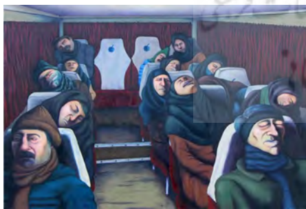
تصویر ۷. سرویس صبح از مجموعه زندگی کاری کارگران در کارخانه، رنگ روغن روی بوم، ابعاد: ۷۰ × ۱۰۰.

در تصویر (۸) نیز فضای داخل یک خانه که ضیافتی در آن برپا است را نشان می‌دهد، در این تصویر مهمان‌ها دورتادور خانه نشسته و مشغول گفت‌وگو و تناول هستند. در فرهنگ و سنت ایرانی هنگام ختنه کردن پسران، مراسمی برای گرامیداشت این رویداد برگزار می‌شده است. جشنی که چندتن از بستگان و آشنایان در آن فراخوانده می‌شدند و در قالب یک مهمانی، میزبان به پذیرایی از ایشان پرداخته و هر یک از میهمانان هدایایی به رسم یادبود برای کودک ختنه‌شده می‌آوردند (بهالگردی، ۱۳۴۲: ۲۰). در این تصویر چهره کودکان بیشترین میزان اغراق را داراست و چهره و اندام افراد بزرگ‌سال کم‌تر دچار اغراق شده است. کودکان همگی با حالتی اعتراض‌گونه حالت گریه دارند و از این که همچون افراد بزرگ‌سال در کنار ایشان بنشینند، معترض هستند. کودک ختنه‌شده که در مرکز مهمانی است از همه بیشتر مشغول فریاد و گریستن است، هم به لحاظ درد وارده و هم کمبود توجه شکایت دارد. در کنار کودکان، اغراق در چهره مادران نیز دیدنی است، کلافگی و درمانگی مادران در برخورد با اعتراض کودک خود و ابراز بشیمانی از مادر شدن، به خوبی در اعضای مبالغه‌آمیز چهره و گاهی بدن آن‌ها هویدا است. هنرمند با به تصویر درآوردن این مهمانی سعی در مضحک و درعین حال دردآور نشان دادن این گونه مراسم را دارد. جایی که کودکی نسبتاً بیمار و نیازمند استراحت باید در قالب میزبان در مراسم حضور یابد و درد خود را کتمان کند. بزرگ نشان دادن چهره کودکان در این تصویر، می‌تواند دلیلی بر نبود کودکی زیبا باشد و اینکه کودکان مجبورند همچون بزرگ‌سالان رفتار کنند. و چه قالبی بهتر از تحریف و گروتسک می‌تواند این پیام را منتقل کند!