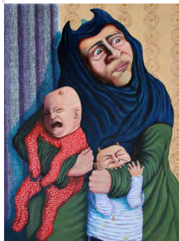
تصویر ۹. خاندان شوهر وارد می‌شود! از مجموعه آدم و حوا، رنگ روغن روی بوم، ابعاد: ۵۰ × ۷۰، منبع: (URL)

در آثار مهنوش بادپر، سیطره موجودات ترسناک و کابوس‌گونه که در واقع انسان‌های آثار او هستند، به وضوح به چشم می‌خورد. انسان‌هایی با چهره‌های مبالغه شده، زنانی که از قالب زنانه خود تهی شده - و به سبب نحوه تفکر و شأن اجتماعی‌شان - و به هیولا تبدیل شده‌اند. تمایز پیکره‌های هیولاگونه و خوفناک آثار بادپر و پیکره متعادل انسانی؛ نسبتاً کم و این نزدیکی اندام‌های هیولوار به دنیای انسانی - که درون آن زندگی می‌کنیم - ترس‌آور بودن آثار وی را دوچندان می‌کند. چهره‌هایی مضطرب، تحریف شده، هولناک و جادوگروار در این آثار، جملگی برای بیان معترضان‌های تصویر شده‌اند. پیش‌تر در رابطه با برخی از آن‌ها سخن به میان آمد و گفته شد که چگونه بیان معترضان‌ها دارند، اما اکنون جنبه کابوس‌گونه این پیکره‌ها مورد توجه است. در تصویر (۹) مادر به همراه دو کودک نشانه داده شده است، چهره مضطرب و پریشان مادر در عین استیصال و درماندگی به تصویر کشیده شده است. نگاه خیره و ترسیده