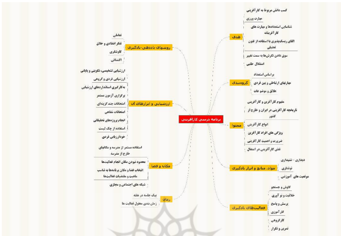
شکل ۱. الگوی برنامه درسی کارآفرینانه مقطع متوسطه دوم