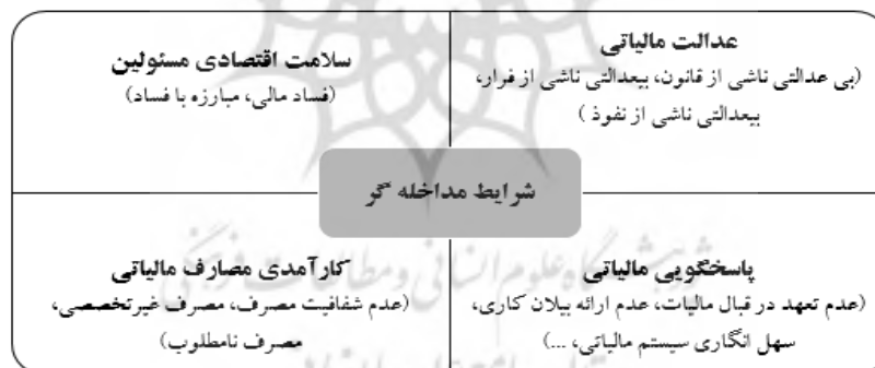
شکل ۳: شرایط مداخله‌گر - مقوله‌های اصلی و فرعی

برونداد درآمدهای مالیاتی در جامعه مطلوب نیست. خدمات ارائه‌شده از طرف دولت متناسب با مالیاتی که دریافت می‌کند نیست و مالیات اثربخشی ضعیف و نامطلوبی برای بهبود مسائل جامعه دارد. افراد مورد مطالعه بر این باورند که درآمدهای مالیاتی به صورت نامطلوب هزینه می‌شود. هزینه‌کرد مالیات عام‌المنفعه نیست و به صورت نابجا در راستای منافع افراد و گروه‌های خاص هزینه می‌شود. مشارکت‌کننده‌ای این‌گونه نقل می‌کند: «مالیات‌ها پرداخت می‌شود، یکجا جمع می‌شود ولی بهینه مصرف نمی‌شود، اتلاف پول است یعنی پولی که ما دادیم جایی صرف شده که صحیح مدیریت نشده، بهینه‌سازی نبوده به جای اینکه این پول جای درستی خرج بشه، جایی خرج شده که اثر مطلوبی در جامعه ندارد».