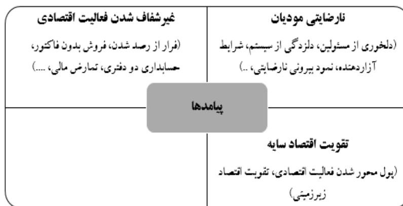
شکل ۵: پیامدها - مقوله‌های اصلی و فرعی