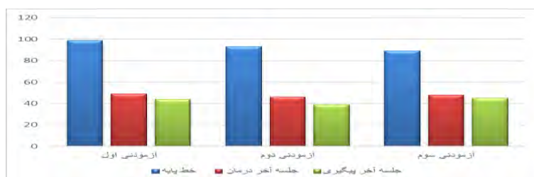
نمودار ۲. نمره راهبردهای کنترل فکر در پرسشنامه راهبرد کنترل فکر (قبل از درمان، بعد از درمان و پیگیری یک ماهه) برای هر سه آزمودنی

مورد بررسی را نشان داده است و تغییر اندکی در دوره پیگیری نیز قابل مشاهده است. در جدول ۲، درصد بهبودی درمان و پیگیری و اندازه اثر درمان برای هر سه بیمار در پرسشنامه راهبردهای کنترل فکر ارائه شده است. قابل ذکر است که درصد بهبودی، نسبت به نمره‌ها بیماران در مرحله خط پایه سنجیده شده است.