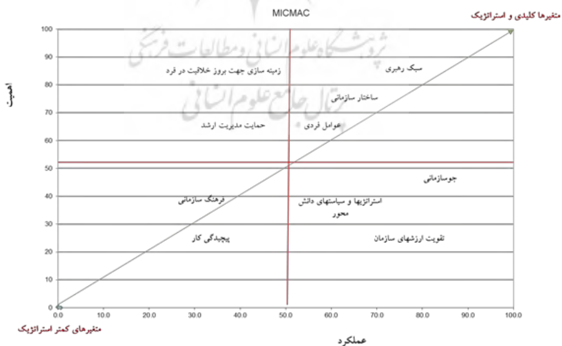
شکل ۲: جایگاه متغیرهای تأثیرگذار و تأثیرپذیر در نمودار دوبعدی

در شکل دو ماتریس اهمیت-عملکرد پیشران‌های خلاقیت نشان داده شده است که در آن پیشران‌های سبک رهبری، ساختار سازمانی، عوامل فردی، زمینه‌سازی برای بروز خلاقیت در فرد و حمایت مدیریت ارشد دارای بیشترین درجه اهمیت بودند. همچنین، پیشران‌های خلاقیت با توجه به قرارگیری در مدل به چهار دسته گروه‌بندی شدند. بر اساس