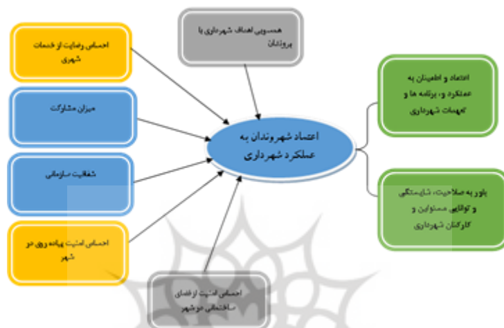
شکل (۱). مدل مفهومی تحقیق مبنی بر عوامل مؤثر بر میزان اعتماد شهروندان به عملکرد شهرداری ساری

این تحقیق، با ترکیب نظریه‌های گیدنز، زتومکا، پاتنام، فوکویاما و پیشینه تجربی تحقیق، عوامل مؤثر بر میزان اعتماد شهروندان به عملکرد شهرداری ساری بر اساس شش مؤلفه همسویی اهداف شهرداری با نیازهای شهروندان، احساس رضایت از خدمات شهری، میزان مشارکت، شفافیت سازمانی، احساس امنیت پیاده‌روی در شهر و احساس امنیت از فضای ساختمانی در شهر بررسی شده است. این شش مؤلفه به صورت مدل تحلیلی در شکل (۱) نشان داده شده‌اند.