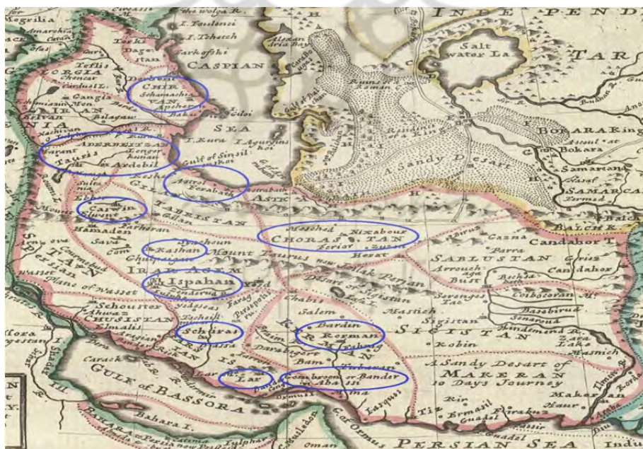
نقشه شماره ۱ - پراکنده مکانی زلزله‌های ایران در دوره صفویه