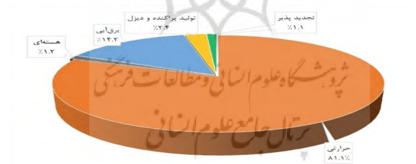
شکل ۳: سهم روش‌های مختلف در تولید برق در کشور ایران (غلامی و همکاران، ۲۰۱۹)

سهم انواع روش‌های تولید برق در کشور، در شکل ۳ آمده است. مطابق شکل، برق حرارتی با سهم ۸۱/۱ درصدی، غالب‌ترین روش تأمین برق در ایران به‌شمار می‌آید. برق تولید پراکنده و دیزلی نیز اگرچه در قالب نیروگاه‌های حرارتی بزرگ قرار نمی‌گیرند، اما از آنجایی که از سوخت فسیلی استفاده می‌کنند، در این پژوهش در کنار برق حرارتی و به‌عنوان گفتمان برق فسیلی در نظر گرفته می‌شوند. برق حاصل از منابع تجدیدپذیر و انرژی هسته‌ای، در حال حاضر حدود یک درصد از تأمین انرژی الکتریسیته ایران را به عهده دارند.