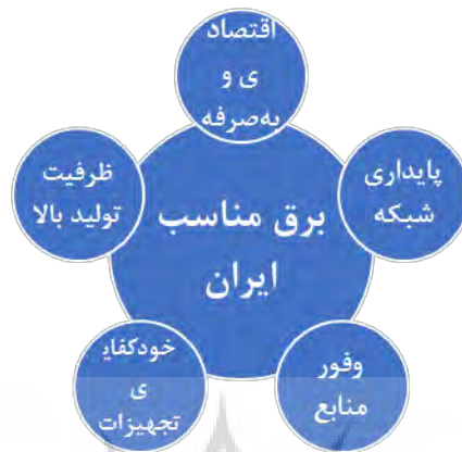
شکل ۴: مفصل‌بندی گفتمان برق فسیلی

می‌سازند اما نقاط ضعفی مانند «محدودیت منابع فسیلی»، «آلاینده‌گی نیروگاه‌های فسیلی» را ناچیز و غیرمهم جلوه می‌دهند.