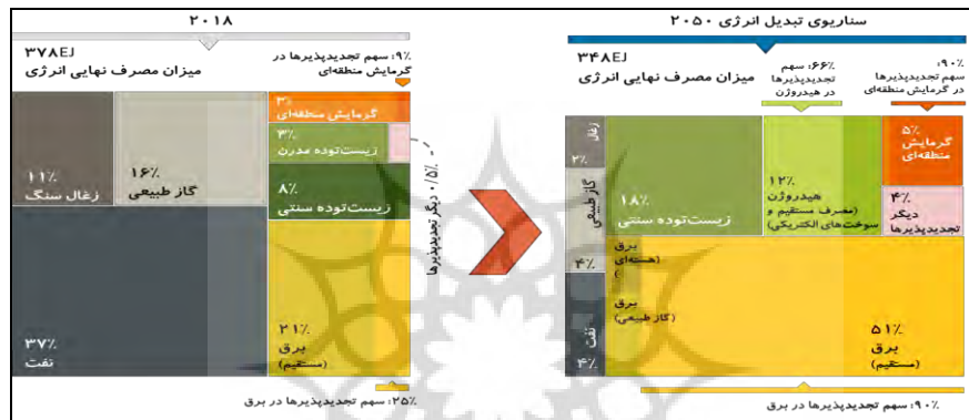
شکل ۱: آینده بهره‌برداری از منابع انرژی (آژانس بین‌المللی انرژی تجدیدپذیر، ۲۰۱۹)

نیاز روزافزون به انرژی با رشد جمعیت و در کنار آن تغییر سبک زندگی و وابستگی بیشتر به انرژی الکتریسیته در سال‌های اخیر، چالش‌های متعددی را در زمینه تأمین پایدار انرژی در سطح جهانی ایجاد کرده است. راهکارهای متعددی برای رفع این چالش‌ها در دنیا ارائه شده است که در این میان، استفاده از انرژی‌های تجدیدپذیر و بهینه‌سازی مصرف از اصلی‌ترین روش‌هاست (غلامی و همکاران، ۲۰۲۲).