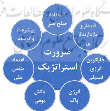
شکل ۶: مفصل‌بندی گفتمان هسته‌ای ضرورت استراتژیک

دال مرکزی گفتمان انرژی هسته‌ای، «ضرورت استراتژیک» برای تجهیز ایران به صنعت هسته‌ای است. مهمترین مفهومی که این ضرورت را توجیه می‌کند، ایجاد «اقتدار» برای نظام و قدرت بازدارندگی ناشی از این توانمندی است. علاوه بر این، در بخشی از این گفتمان به ضرورت «تنوع بخشی به سبد انرژی» کشور اشاره می‌شود. در این معنا انرژی هسته‌ای به‌عنوان جایگزین سوخت فسیلی با مزیت «پاک» و دوستدار محیط‌زیست بودن مطرح می‌شود. «سودآور»، «بومی»، «موجب افتخار و عزت» و «نشانه پیشرفت و توسعه» نیز از دیگر کلیدواژه‌هایی است که در گفتمان هسته‌ای، مطرح شده است (شکل ۶).