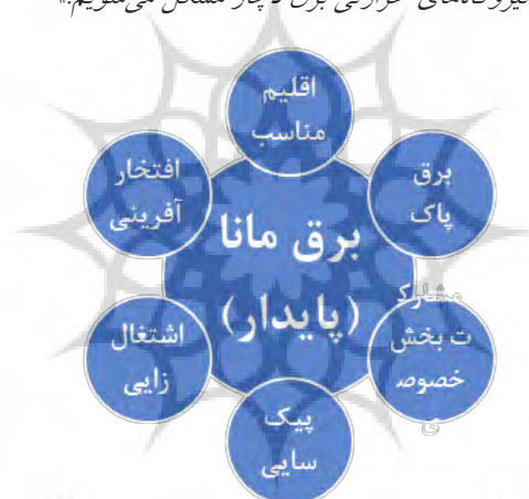
شکل ۵: مفصل‌بندی گفتمان برق تجدیدپذیر

حمید چیت‌چیان وزیر سابق نیرو: «طبق پیش‌بینی تا سال ۱۴۱۵ ایران به ۵۵۰ میلیارد کیلووات ساعت برق نیاز دارد که اگر به تجدیدپذیر توجه نشود حتی برای تأمین این میزان برق در تأمین سوخت نیروگاه‌های حرارتی برق دچار مشکل می‌شویم.» ۱