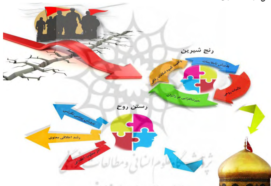
نمودار شماره (۳). از رنج شیرین تا رستن روح

۷. مدرسه اربعینی در مقایسه با آموزش رسمی اثربخش‌تر است؛ چراکه تغییر رفتار و نگرش آنان بیش از آنکه متأثر از آموزش‌های رسمی باشد، تابع حضور رودررو و لحظه‌به‌لحظه با موقعیت‌ها و شرایط عینی است (سعیدی رضوانی و باغگلی، ۱۳۸۹: ۱۲۲؛ به نقل از اسکندری، ۱۳۸۳).