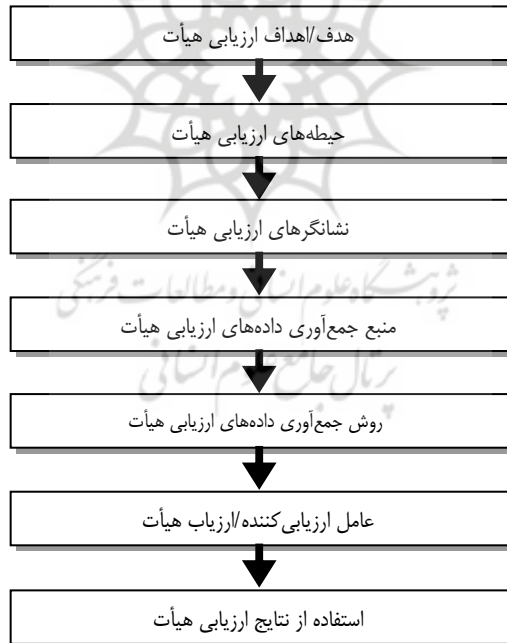
شکل ۱: چارچوب مفهومی مطالعه برای ارزیابی هیأت امنای دانشگاه‌های علوم پزشکی

علاوه بر هفت بخش مذکور، کیل و نیچلسون معتقدند در طراحی الگوی ارزیابی هیأت، پاسخ به این سؤال که هیأت هر چند وقت یکبار باید ارزیابی شود، نیز مهم است. همان‌گونه که پیش‌تر اشاره شد، ویژگی انعطاف‌پذیری چارچوب کیل و نیچلسون که قابلیت کاربری آنرا در سازمان‌های مختلف موجب می‌شود و نیز جامعیت آن در مقابل دیگر چارچوب‌های ارائه شده برای ارزیابی هیأت (۳۸)، مهم‌ترین دلایلی بود که انتخاب این چارچوب را به‌عنوان چارچوب مفهومی مطالعه، جهت ارائه و طراحی الگوی ارزیابی هیأت امنای دانشگاه‌های علوم پزشکی سبب شد. بدین ترتیب چارچوب مفهومی مطالعه با اندکی تغییر در نام‌گذاری بخش‌های مختلف چارچوب پیشگفت به صورتی که در شکل ۱ نشان داده شده است، برگزیده و راهنمای مراحل بعدی مطالعه شد.