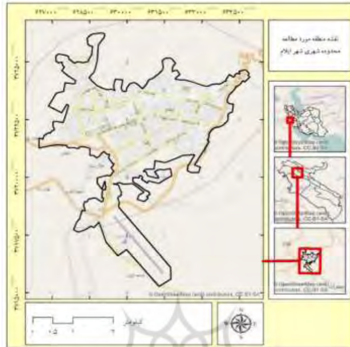
شکل ۲- نقشه موقعیت جغرافیایی شهر ایلام در تقسیم‌بندی سیاسی کشور (ترسیم: نگارندگان).