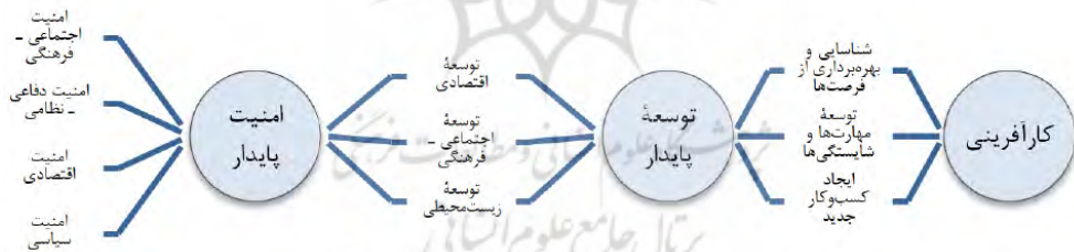
شکل ۱. الگوی نظری ارتباط بین مفاهیم اصلی تحقیق

مطابق یافته‌های پژوهش، از دیدگاه نظری و مفهومی، رابطه مستقیمی میان مفاهیم کارآفرینی، توسعه پایدار و امنیت پایدار در مناطق مرزی برقرار است؛ به‌گونه‌ای که در شکل ۱ مشخص است، از راست به چپ، توسعه کارآفرینی در مناطق مرزی به توسعه پایدار در این مناطق منجر می‌شود. بر این اساس، در صورت توسعه پایدار اقتصادی، اجتماعی - فرهنگی و زیست‌محیطی مناطق مرزی، می‌توان به ایجاد و برقراری امنیت پایدار در این مناطق دست یافت.