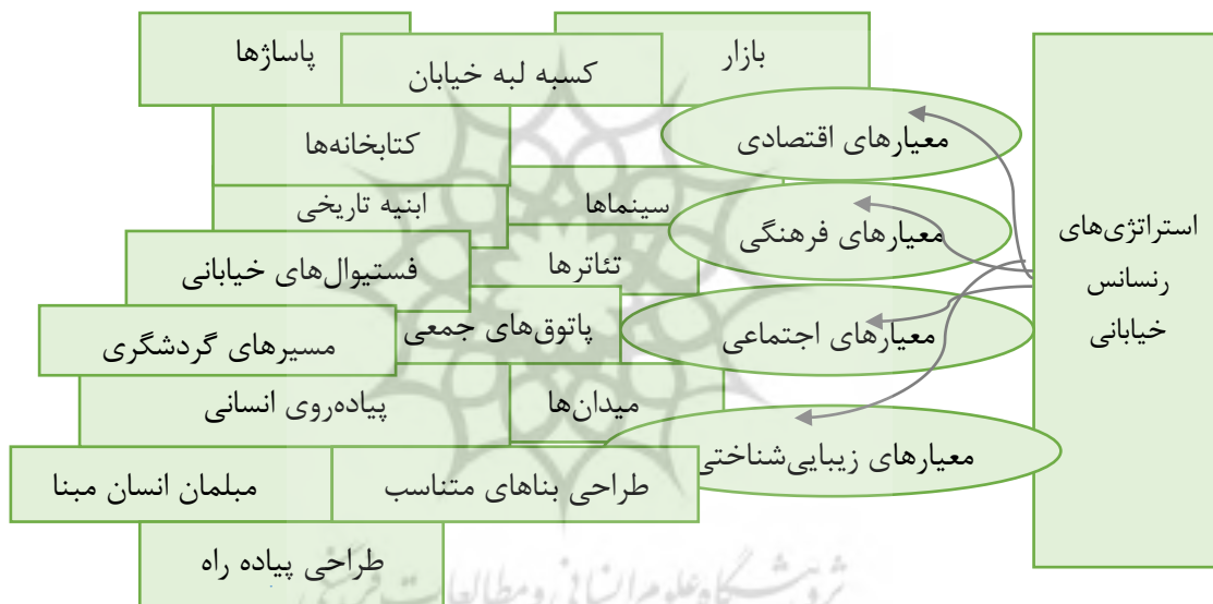
شکل (۱) چارچوب مفهومی مطالعه

فرهنگی غرب است (زندى و همکاران، ۱۳۹۴: ۴). رنسانس خیابانی ۱ انقلابی است بر سپهر اندیشه تکنو کرات و نخبه‌گرای شهری که بی‌باکانه بر کالبد خسته و بی‌روح شهر می‌تازد و مبتنی است بر ارجمندی کرامات انسانی، جنبش مردم‌سالارانه و اجتماعی _ فرهنگی که سعی دارد از قرون وسطی خیابان‌های نازیباى شهر که معبرى بیش نمی‌باشند گذر کند و منجر به تجدید مطلوبیت بر ابعاد گوناگون ادراکی، عملکردی و زیبایی شناسانه از فضاهای همگانی شهر که می‌تواند خیابان، پیاده راه، میدان و یا گر گاه محله‌ای باشد، شود. از آنجایی که پرداختن به مسئله مندی شهری بدون اندیشیدن بر خیابان‌های شهر امری ناممکن است؛ بنابراین رنسانس خیابانی نوعی خاص بودگی ۲ از فضا است که می‌تواند با تولید مکان برای انسان بازتولیدی از فضاهای اجتماعی داشته باشد و البته می‌تواند پایانی بر آشفتگی‌های دیالکتیکی ناشی از پروژه مدرنیسم ناتمام و نا مدرنیته حاکم بر فضای اجتماعی باشد. از آنجایی که لوفور فضاهای زیسته را واقعیت‌هایی اجتماعی دانسته و فضای اجتماعی را ابژه‌ای بر فراخوان سوژه می‌شناساند، رنسانس خیابانی هم تفسیری است از تثلیث تولید فضا که به عقیده شیلدز ۳ می‌تواند تزی برکنشگری و درک روزمره شهروندان از فضا و آنتی‌تزی از لحظات زیست شده بر آن باشد. این تجدید حیات می‌تواند در خیابان، پیاده راه، میدانگاه و هر فضای همگانی دیگری تبلور یابد. رنسانس خیابانی با ارائه‌ی استراتژی‌های راهبردی امکان نوزایی در خیابان را فراهم می‌کند. شکل (۱) شمایی از راهبردهای رنسانس مبنا در خیابان است.