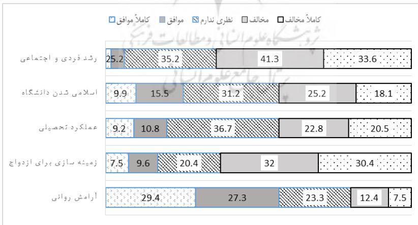
نمودار ۱: پنج محور کلی پرسشنامه با طیف لیکرتی

این مطالعه با هدف بررسی نظرات اساتید و دانشجویان، نسبت به مزایا و معایب طرح تفکیک جنسیتی در دانشگاه فرهنگیان یزد (واحد خواهران و برادران) به‌انجام رسید و نتایج آن در پنج محور رشد فردی و اجتماعی، اسلامی‌شدن دانشگاه، عملکرد تحصیلی، آرامش روانی و زمینه‌سازی برای ازدواج ارزیابی شد. همان‌طور که اشاره شد نظرات شرکت‌کنندگان در قالب طیف لیکرت با در دسترس قرار دادن پنج گزینه کاملاً مخالفم، مخالفم، نظری ندارم، موافقم و کاملاً موافقم جمع‌آوری شد. نتایج برآمده از تحلیل پرسشنامه‌ها در پنج محور فوق، در نمودار ۱ نمایش داده شده است.