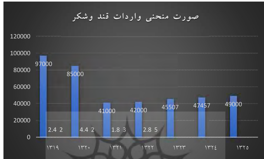
نمودار ۱. صورت منحنی واردات قند و شکر از سال ۱۳۱۹ تا ۱۳۲۵

به شدت کاهش پیدا کرده است . در جدول (شماره ۱) . نمودار ۱ میزان تولید داخلی و واردات قند و شکر از ۱۳۱۹ تا ۱۳۲۵ به طور مقایسه ای آورده شده است .