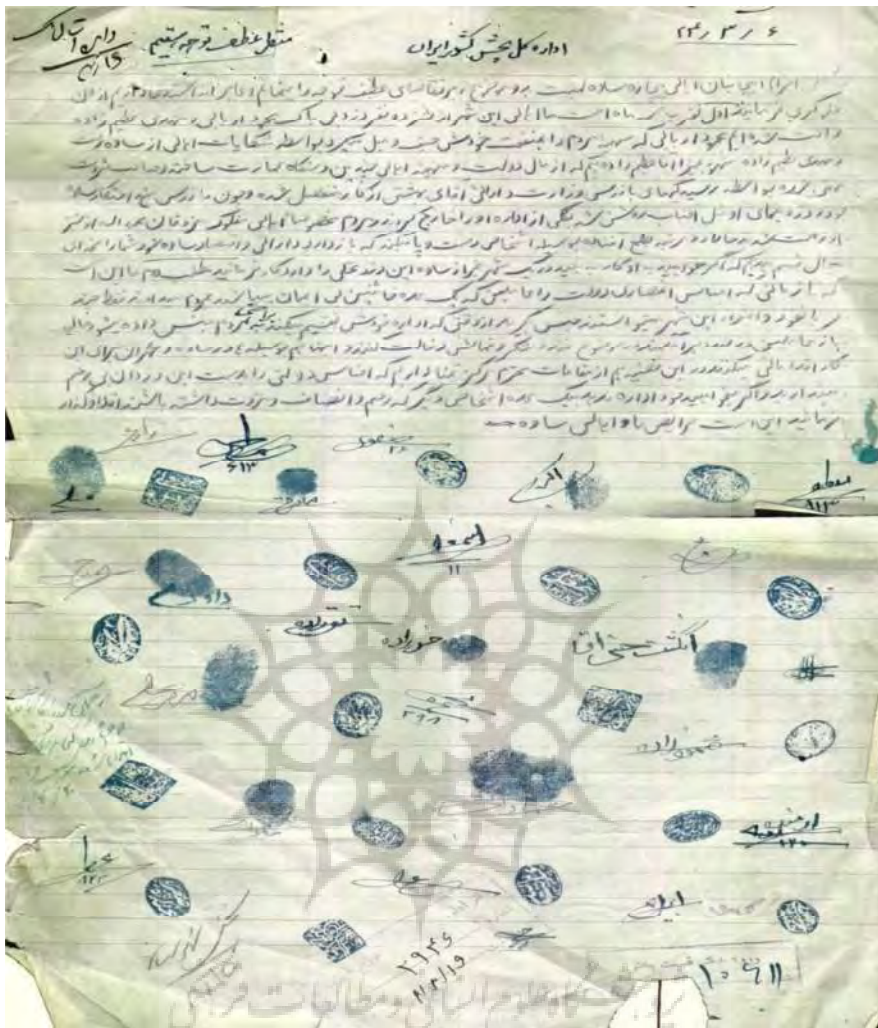
سند ۲. عریضه مردم ساوه از فساد ماموران به وزارت دارایی