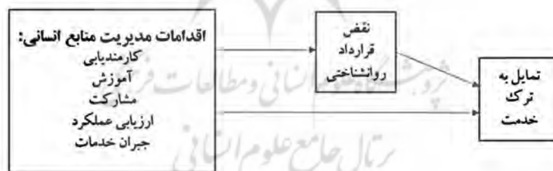
شکل ۱- مدل مفهومی تحقیق (سانتانام و همکاران، ۲۰۱۷)

در این مطالعه، تأثیر برخی از اقدامات مدیریت منابع انسانی از دیدگاه چن و هانگ (۲۰۰۹) و سانتانام و همکاران (۲۰۱۷) شامل کارمندیابی، آموزش، مشارکت، ارزیابی عملکرد و جبران خدمات بر قصد ترک خدمت و نقض قرارداد روان شناختی کارکنان شرکت گاز شهر رشت مورد بررسی قرار می‌گیرد. هم‌چنین به بررسی نقش نقض قرارداد روان شناختی در رابطه بین اقدامات مدیریت منابع انسانی و قصد ترک خدمت کارکنان می‌پردازیم. با توجه به ادبیات نظری و پیشینه تجربی، مدل مفهومی این تحقیق در شکل (۱) ترسیم شده است.