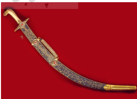
تصویر ۹: ویتترین ۲۵، شماره ۵، خزانه جواهرات ملی ایران.

کلاهیک این شمشیر زرنشان، به سنگ‌های قیمتی و گرانها از جمله الماس، یاقوت و زمرد مرصع شده است. دسته آن بدون تزیین و ساده است (تصویر ۹). بلچاق شمشیر، پوشیده از الماس است، حال آنکه قطعه‌ای یاقوت در مرکز آن و در بین الماس‌ها جلوه‌گری می‌کند. در اطراف این یاقوت، شاهد دو ردیف الماس هستیم. در ردیف اول که قطعات کوچک‌تر را شامل می‌شود، تعداد ۱۲ و در ردیف دوم، ۱۰ عدد الماس بزرگ‌تر دیده می‌شود. انتهای بازوی افقی بلچاق نیز به دو صفحه تخت دایره‌شکل شبیه دکمه ختم می‌شود. این نوع تزیین در بلچاق‌های دوره قاجار رایج بوده است و در شمشیرهای دیگری هم دیده می‌شود. تا جایی که در تصویر موجود قابل تشخیص است، در فاصله بین بلچاق و بست اول روی غلاف، عبارت «سلطان ناصرالدین شاه» به چشم می‌آید که هویت صاحب شمشیر را مشخص می‌نماید. مرصع‌کاری روی بست‌ها مانند تزیین بلچاق است با این تفاوت که یک ردیف ۱۰ تایی الماس گرداگرد آن واقع شده است. هم‌چنین نام ناصرالدین شاه چنانچه حرف «د» مشدد خوانده شود، دارای ۱۰ حرف است. عبارت دیگری که روی غلاف قابل تشخیص است عبارت «رب الفتح و لا