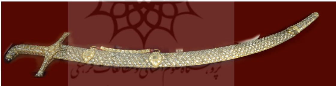
تصویر ۷: ویتترین ۲۴، شماره ۱۹، شمشیر جهانگشای نادری، خزانه جواهرات ملی ایران.

از دیگر شمشیرهایی که به جرأت می‌توان گفت جزو شاهکارهای ترصیع به شمار می‌آید، اثر معروف به «شمشیر جهانگشای نادری» است (تصویر ۷). این اثر، توجه هر بیننده‌ای را متوجه تالو و درخشش قطعات الماس خود می‌کند و هر چشمی، از کثرت نورافشانی قطعات، با حیرت و اعجاب به آن دوخته می‌شود. نادرشاه بدون شک یکی از امیران ایرانی با کارنامه‌ای درخشان در تاریخ پر فراز و نشیب ایران است. این شمشیر، یادگاری از جهانگشایی بزرگ است که نه تنها ملتی را از جنگ‌های داخلی و تعارض دشمنان رهایی داد، بلکه کشوری نیرومند چون هندوستان را نیز فتح کرد. شمشیر جهانگشای نادری با شمشیر شارلمانی محفوظ در موزه وین برابر است که روزگاران امپراتوری مقدس روم را به خاطر می‌آورد. روایت شده است که فاتح هند، به گاه پیکار این شمشیر را به دست می‌گرفته است (مین و تشینگام ۱۳۵۵، ۱۵). این اثر هم مانند دیگر شمشیرهای خزانه جواهرات ملی، جهت نمایش شکوه و قدرت شاهان و تأکیدی بر مقام ایشان در نظر بینندگان بوده است.