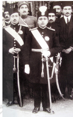
تصویر ۱۱: احمدشاه و عده‌ای از رجال درباری (بهمن‌پور ۱۳۸۵، ۱۰۹).

در پایین قبضه، زیر همان سه میله، میله‌ای گرد وجود دارد که سر این میله نیز مانند سر ماری به نظر می‌آید که یکی از چشم‌هایش زمرد و دیگری از یاقوت است. بخش پایینی این قسمت نیز یکی در میان با زمرد و یاقوت مزین شده است، حال آنکه روی آن فقط یاقوت به چشم می‌آید. در فرهنگ عامه شهرت دارد که زمرد، مار را کور می‌کند و مارگیران، انگشتر زمرد همراه داشته‌اند. خیرگی مار در برابر درخشش رنگ سبز زمرد، فرصت به دام انداختن مار را فراهم می‌کند. در این شمشیر، استفاده از دو سنگ سرخ و سبز در چشمان مار می‌تواند اشاره به تسلیم مار سرخ چشم در برابر زمرد وجود شاه باشد.