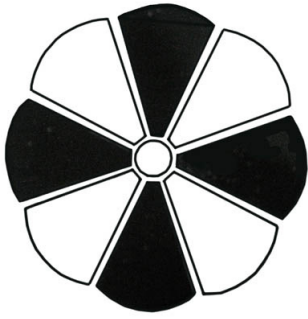
تصویر ۱۴: نمونه گل لوتوس