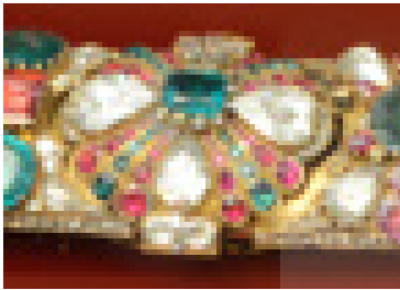
تصویر ۱۵: نقش روی بست شمشیر شاهی، خزانه جواهرات ملی ایران.