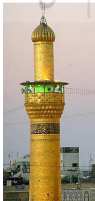
تصویر ۵ - مناره حرم امام حسین در کربلا.