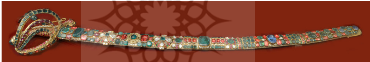
تصویر ۱۰: ویتترین ۳۰، شماره ۴۸، شمشیر سلطنتی یا شمشیر شاهی، خزانه جواهرات ملی ایران.

این اثر، یکی از شاهکارهای ترصیع به شمار می آید و «شمشیر شاهی» یا «شمشیر سلطنتی» است. این شمشیر بی نظیر در کمال هنری و کاربرد تزیینات، مهارت جواهرسازان و هنرمندان این دوره در تراش احجار کریمه و ترصیع را به خوبی نشان می دهد (تصویر ۱۰). به طور کلی، این شمشیر جدا از سایر اشیای موجود در خزانه جواهرات ملی، نماینده کمال استعداد و هنر استادانی است که آن را به این شکل حیرت افزا درآورده اند. این شمشیر که آراسته به جواهرات گوناگون است، هدیه ای گرانبها از طرف امین السلطان به ناصرالدین شاه است. امین السلطان ملقب به نام «اتابک اعظم» با بهره مندی از ثروت فراوان، قادر به پیشکش این هدیه گران قیمت به شاه ایران بوده است. کاملاً روشن است که با شمشیری جواهرنشان نمی توان به جنگ رفت و بی شک این شمشیر برای استفاده در تشریفات ساخته شده و به هیچ عنوان کاربرد نظامی نداشته است.