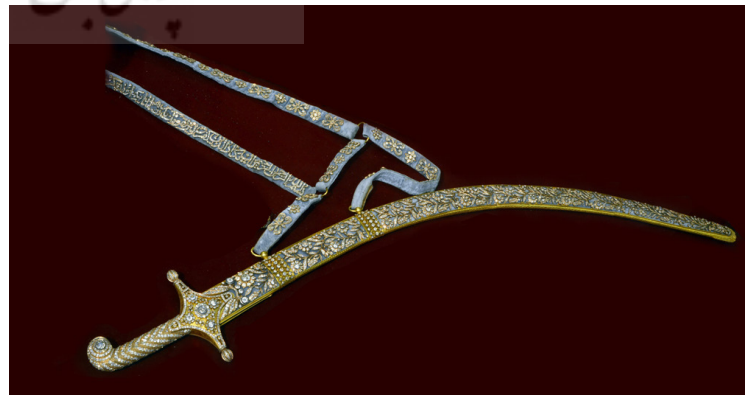
تصویر ۴: ویتترین ۱۵، شماره ۱۲، خزانه جواهرات ملی ایران.