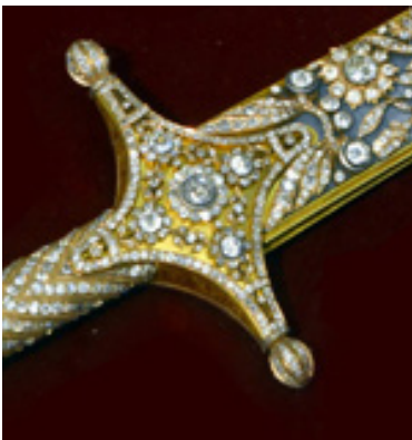
تصویر ۶: بلچاق شمشیر شماره ۱۲، ویتترین ۱۵، خزانه جواهرات ملی.