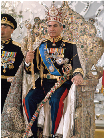
تصویر ۱۶: محمدرضا پهلوی همراه با شمشیر شاهی

نام سازنده یا هر نوشته دیگری داخل ترنج، معمول بوده است. در واقع، ترنج نمادی از خورشید است و در بین ایرانیان برای عامل اصلی جریان زندگی روی زمین، تقدس و احترام قائل بوده‌اند (غراب ۱۳۸۴، ۱۹۵).