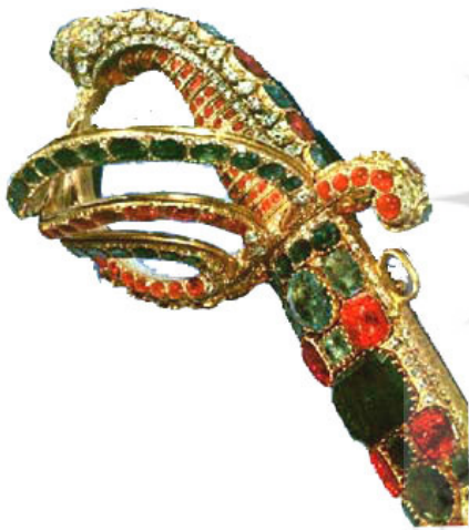
تصویر ۱۳: نمای نزدیکی از دسته شمشیر شاهی.

سه میله خمیده‌ای که ضامن را تشکیل داده‌اند، به سر ماری الماس نشان منتهی می‌شوند که چشم‌هایی از یاقوت سرخ دارد. میله وسط، با یاقوت و میله‌های بالا و پایین، با زمرد ترصیع شده‌اند. نحوه قرارگیری این سنگ‌ها به گونه‌ای است که تا حدودی پوست مار را به بیننده القا می‌کنند (تصویر ۱۳). مشتاق خراسانی بر این عقیده است که این گونه شمشیرهای دارای ضامن‌های سه میله، تأثیرات شیوه فرانسوی را به خوبی آشکار می‌کنند و تأثیر گرفته از مدل‌های فرانسوی هستند (Moshtagh Khorasani 2006, 205).