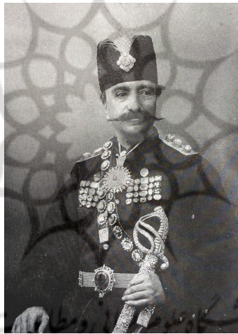
تصویر ۱۲: پرتوهای از ناصرالدین شاه (Rabi) (۱۹۹۹، ۷۸).