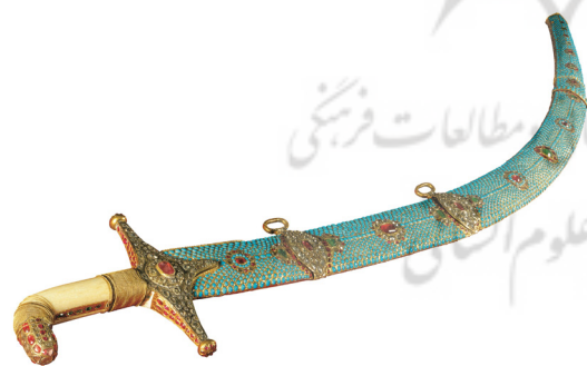
تصویر ۲: ویتترین ۵، شماره ۲۰، خزانه جواهرات ملی ایران.

از شاهکارهای هنری ایرانیان، شمشیری پوشیده از فیروزه می‌باشد که فیروزه‌های یکدست و از بهترین نوع، با مهارتی بسیار به کار رفته‌اند. طول این شمشیر، ۹۷ سانتی‌متر است و کلاهک دسته آن، مرصع به یاقوت و الماس است (تصویر ۲). تیغه این شمشیر، هر چند فاقد شناسنامه است، اما از فولاد آبدیده نوع اعلاست که از رایج‌ترین نوع تیغه‌ها در آن زمان بوده است. امکان دارد که این شمشیر در سده ۱۷ م. (۱۱ ه.ق) در شمال شرق ایران ساخته شده باشد. دسته شمشیر که از عاج است به احتمال بسیار در زمان پرداختن تیغه ساخته شده است اما ترصیعی که بر قبضه آن دیده می‌شود، بعدها به وجود آمده است و این در مورد غلاف نیز صدق می‌کند. جنس غلاف از زر است و بلاط فیروزه دارد. بر این بلاط، دو بست و چند گلچه جواهرنشان با تخمه‌های یاقوت، لعل و زمرد دیده می‌شود و سوی دیگر غلاف، از زر ساده منقوش است. تمامی سنگ‌های سرخ کوچکی که در ترصیع به کار رفته، یاقوت هستند (مین و تشینگام ۱۳۵۵، ۱۰۶).