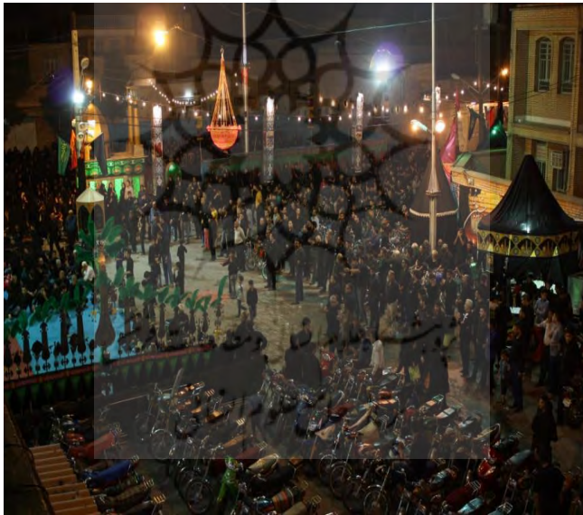
برگزاری مراسم مقتل خوانی سال ۱۳۹۵