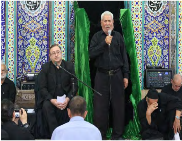
مراسم ای وایلا