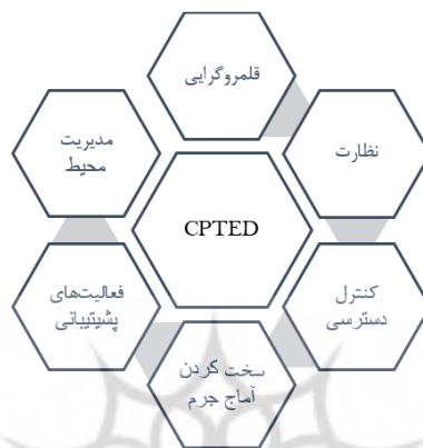
شکل ۱. اصول نظریه CPTED؛ مأخذ. (Cozens and Love, ۲۰۱۵: ۳۹۶)

راحت‌تر از تغییر و مبارزه با ضعف‌های بشری و اصلاح شخصیت افراد است در نتیجه راه حل مناسب برای پیشگیری از وقوع جرم را کم کردن فرصت‌های مجرمانه می‌داند. این نظریه را می‌توان این‌گونه تعریف کرد طراحی مناسب و طراحی مناسب و کاربری مؤثر از محیط و ساختمان که منجر به کاهش جرم و ترس ناشی از جرم می‌شود به عبارت دیگر طراحی مناسب و استفاده درست از محیط می‌تواند علاوه بر پیشگیری از وقوع جرم، کیفیت زندگی را بهبود بخشد و ترس از جرم را کاهش دهد (Crowe, ۲۰۰۰: ۴۶).