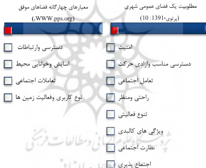
نمودار شماره ۲: نمودار معیارهای چهارگانه فضاهای موفق و نمودار مطلوبیت یک فضای عمومی شهری

از طرفی مطلوبیت یک فضای عمومی شهری تابعی است از امنیت، دسترسی مناسب و آزادی حرکت، تعامل اجتماعی، ویژگی های کالبدی (ابعاد معمارانه و طراحی)، راحتی و منظر، تنوع فعالیت ها، اجتماع پذیری و نظارت اجتماعی (پرتوی، ۱۳۹۱: ۱۰) در نهایت مطلوبیت یک فضای عمومی شهری باید منجر به حضور بیشتر شهروندان در اینگونه فضاها و حتی مشارکت آنان در ساخت بهتر فضا گردد.