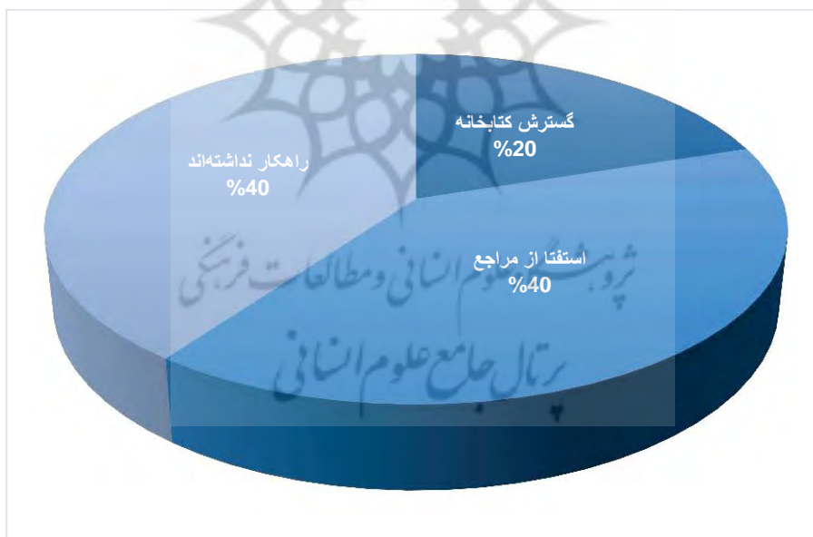
نمودار ۲. موانع کتاب‌های وقفی برای کتابخانه‌های اسلامی

طبق نتایج حاصل از پژوهش، چهار نفر از مدیران کتابخانه‌ها، هیچ راهکاری برای خروج از موانع ایجاد شده برای کتاب‌های وقفی نداشته‌اند. همچنین دو کتابخانه اقدام به گسترش کتابخانه خود و ایجاد کتابخانه پشتیبان، کتابخانه اقماری و کتابخانه‌های وابسته کرده و منابع وقفی را به آن جا منتقل کرده‌اند. علاوه بر آن، یکی از کتابخانه‌ها نیز استفتائاتی را از مراجع اعظام تقلید انجام داده بود که به نتیجه مشخصی دست پیدا نکرده بود.