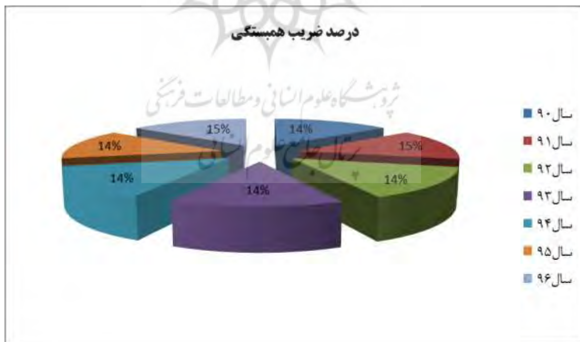
شکل (۳) ضریب همبستگی بر حسب سال مورد نظر