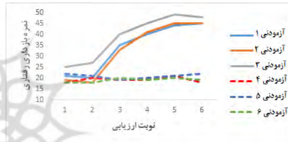
شکل ۲- نمرات بازداری رفتاری آزمودنی‌ها در خلال مراحل پژوهش

جهت آزمون فرضیه دوم پژوهش، مبنی بر اینکه برنامه توان‌بخشی شناختی موجب بهبود کنترل بازداری سالمندان دارای اختلال شناختی خفیف می‌شود، نمرات کنترل بازداری آزمودنی‌ها که از آزمون بروانرو به دست آمد، در مراحل ششگانه پژوهشی به تصویر کشیده و تحلیل دیداری شدند.