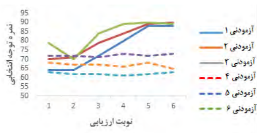
شکل ۱- نمرات توجه انتخابی آزمودنی‌ها در خلال مراحل پژوهش

به‌منظور آزمون فرضیه اول پژوهشی مبنی بر اینکه برنامه توان‌بخشی شناختی موجب بهبود توجه انتخابی در افراد سالمند دارای اختلال شناختی خفیف می‌شود، نمرات توجه انتخابی حاصل از آزمون استروپ آزمودنی‌ها در مراحل ششگانه پژوهش، در قالب شکل شماره ۱ به تصویر کشیده شده و تحلیل‌های دیداری مربوطه ارائه شد.