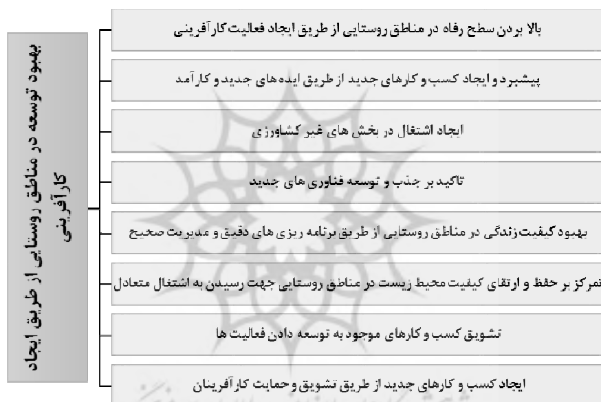
شکل شماره ۵: بهبود توسعه در مناطق روستایی از طریق ایجاد کارآفرینی

دنیای در حال تحول امروز، موفقیت را از آن جوامعی میداند که با ایجاد بسترهای لازم، منابع جامعه را به طور کارآمد با سرمایه‌گذاری مولد به سوی ایجاد ارزش افزوده و تسریع رشد و پیشرفت اقتصادی و افزایش ثروت جامعه، مدیریت و هدایت نماید. ضمن اینکه اگر بسترهای لازم منابع انسانی خود را به دانش و مهارت کارآفرینی مولد تجهیز کند تا آنها با استفاده از این توانمندی ارزشمند، سایر منابع را به سوی ایجاد ارزش و حصول رشد و توسعه، مدیریت و هدایت کنند، فرایند توسعه نیز تسهیل میگردد. این امر در روستاها از اهمیت ویژه‌ای برخوردار است. برنامه‌های توسعه با رویکرد کارآفرینی و در واقع به خدمت گرفتن کارآفرینی روستایی در راستای توسعه روستا، ابزار مهمی در جهت نیل به اهداف توسعه‌ای هستند و اگر به درستی طرح‌ریزی شوند، دستیابی به رشد و توسعه اقتصادی را تسهیل می‌کنند.