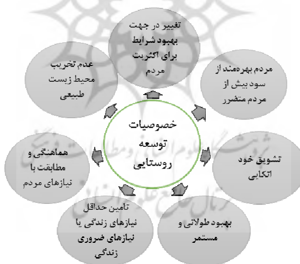
شکل ۳: خصوصیات و ویژگی‌های اصلی توسعه روستایی