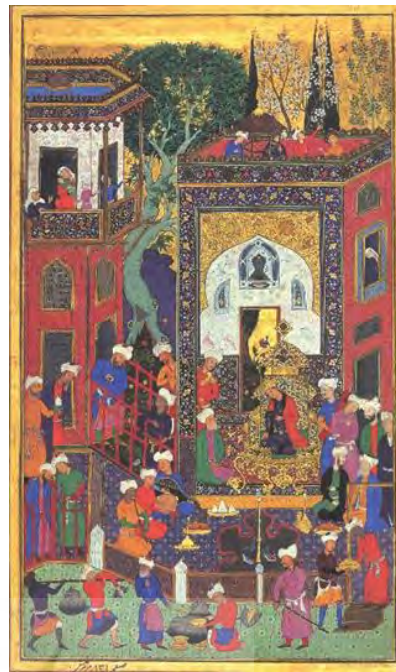
تصویر ۱- ضیافت درباری، نیمه نخست سده ۵۱۱ ق، سبک ایران و هند، (مأخذ: مرقع گلشن، ۱۳۱)