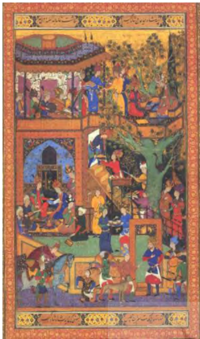
تصویر ۲- مجلس همایون و اکبر شاه، سده ۵۱۰ ق، سبک ایران و هند، (مأخذ: مرقع گلشن، ۷۰)

تعلیق بین دو بعد و سه بعد قرار گرفته است. و فضای عمومی نگاره گرایش بیشتر به سبک ایران دارد و در نهایت این اثر در عین تنوع دارای خصوصیات متحد است (تصویر ۱).