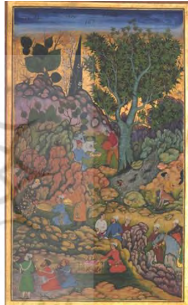
تصویر ۳- تفرج در طبیعت، سبک ایران و هند، (مأخذ: مرقع گلشن، ۲۱۸)

در نگاره اسب و مهتر نیز همانند تصاویر پیشین در قابی مستطیل شکل قرار گرفته است. و نظام ترکیب‌بندی آن مورب، عمود و افق به سبک ایرانی است. طبیعت در ۳ پلان آن با زاویه دید مقابل مشاهده می‌شود. عناصر منظره در پایین نگاره شامل جوی آبی که در کنارش بوته‌های سبز و تکه سنگ‌ها دیده می‌شود. بعد از آن پس‌زمینه‌ای که روی آن سنگ‌های کوچک و بزرگ همراه با انواع پوشش گیاهی و اسبی بزرگ در مرکز آن مشاهده می‌شود. اما در پلان دوم درخت چنار تنومند پر برگ که پرندها روی شاخه‌های آن نشسته و یا در پرواز هستند، در سبک ایرانی دید می‌شود. ولی در بیشترین قسمت این پلان تپه‌های سنگی که در روی آن درختچه‌های سبز و جوی‌های آب نقره فام از میان آن در جریان است را می‌بینیم و در آخر برجی از دوردست‌ها و نیز آسمان طلایی درخشان به سبک ایرانی نمایان است. تکه سنگ‌ها همراه با پوشش گیاهی سراسر نگاره، درختچه‌ها، پرندگان و برگ درخت چنار به صورت عنصر بصری نقطه دیده می‌شود. و از لحاظ ساختاری ریتم و حرکت را در آنان می‌توان دید. خط و سطح در این کار حضور خاصی ندارد. حجم‌پردازی و بافت به صورت نقطه پرداز در سبک ایرانی بر روی تپه‌های سنگی، درخت چنار و اسب به شیوه‌ی پر تکلف در سبک هندی دیده می‌شود. هارمونی رنگ بر کار حاکم است. رنگ‌های متضاد اجزای طبیعت در ارتباط با پوشش پیکره ایجاد تضاد رنگی سرد و گرم، روشن و تیره کرده است. و شیوه قرارگیری اسب و درخت چنار در یک راستا به لحاظ ساختاری باعث تقسیم‌بندی عمود در نگاره شده است. و اجزای طبیعت در تعادل قرار دارد و همان‌طور که دیده می‌شود منظره‌پردازی در این اثر نیز