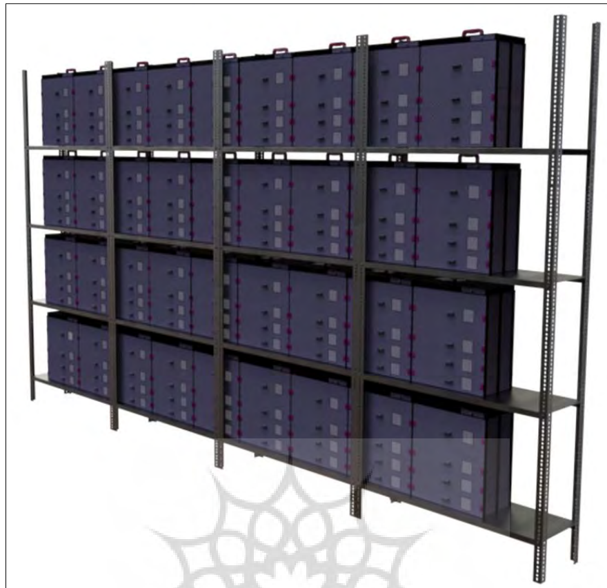
شکل ۴: نمایی از نحوه قرارگیری جعبه‌های مورد طراحی برای اسکلت انسانی در مخازن موزه‌ها Fig. 4: Putting boxes in museum tanks

پژوهه باستان‌سنجی پرتال جامع علوم انسانی