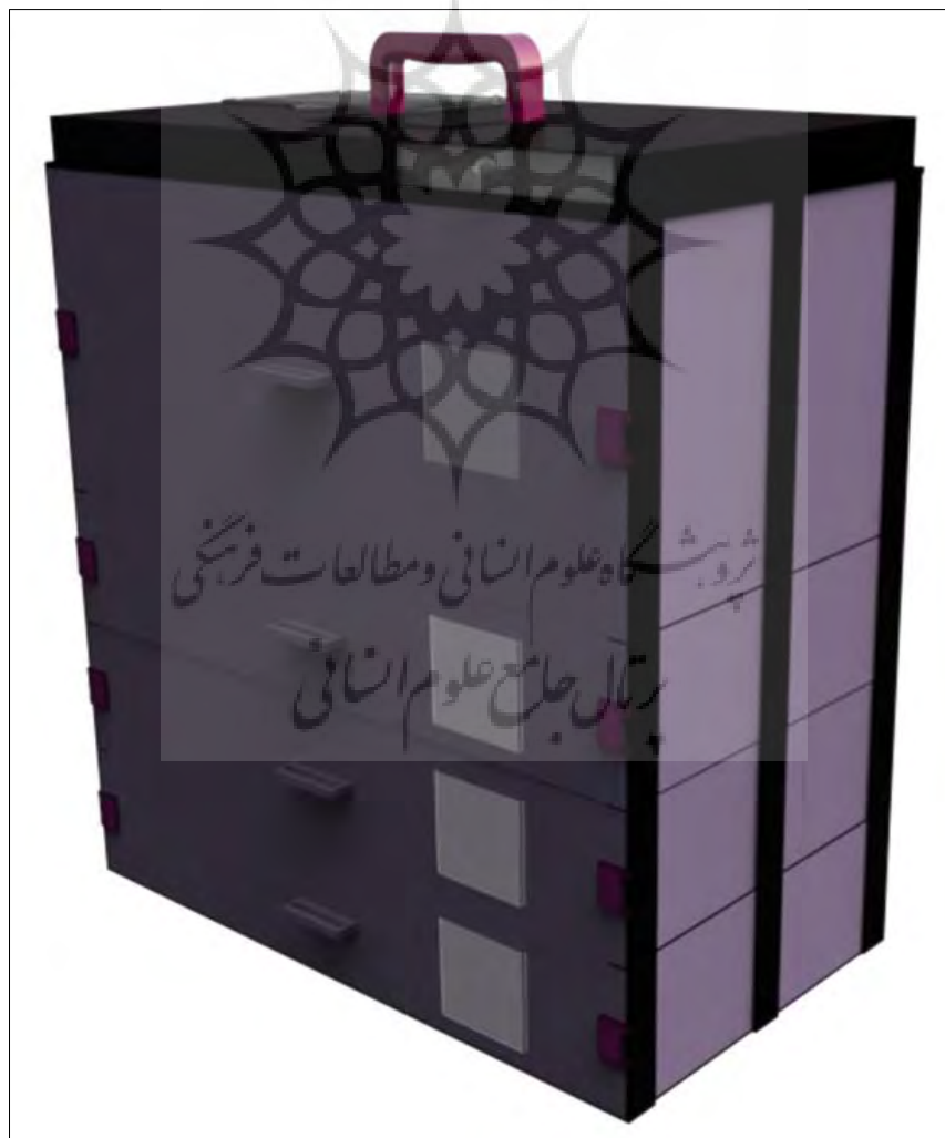
شکل ۱: نمایی از جعبه طراحی‌شده برای اسکلت انسانی

نیاز به چند ابزار مختلف دخیل در بسته‌بندی است، می‌تواند کاملاً توجیه‌پذیر باشد که با تولید انبوه قاعدتاً قیمت نهایی نیز کمتر خواهد بود. مواد پیشنهادی برای ساخت این طرح می‌تواند مواد پلی‌استری برای بخش خارجی، و برای بخش داخلی آمیزه‌ای از اسفنج‌های پلی‌اورتانی به همراه روکش پلی‌استری باشد که علی‌رغم سبک و مقاوم بودن، ماندگاری بالای محصول نهایی را نیز در پی دارد. همچنین این طرح، با توجه به امکان استفاده از آن، از زمان کشف آثار تا حمل‌ونقل، ذخیره و امکان دسترسی جهت‌دار به بخش‌های مختلف استخوانی به صورت کلی و مجزا، می‌تواند توجیه‌های اقتصادی و کاربردی مناسبی را نشان دهد. از طرفی