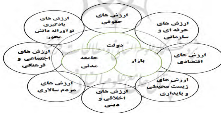
شکل ۲: مدیریت دولتی به مثابه خلق ارزش‌های عمومی و تحقق ارزش‌های عمومی در گفتمان

سالاری، ارزش‌های یادگیری نوآورانه دانش محور را بوجود می‌آورند و آن‌ها از همه ظرفیت‌ها در عینیت بخشیدن به این ارزش‌ها و پاسداشت و مراقبت از این ارزش‌ها استفاده می‌کنند. این مجموعه ارزش‌ها، نوعی باور اعتقادی و درونی هستند و اجماع و پذیرش حداکثری را میان کنش‌گران جامعه بوجود می‌آورند و همه ذینفعان جامعه نسبت به ارزش‌های عمومی نوعی تعلق ذاتی و درونی پیدا می‌کنند. در واقع می‌توان اظهارداشت که پارادایم مدیریت دولتی در بافت ارزش عمومی بر خلاف پارادایم‌های پیشین نهادی تر و هنجاری تر است و ترکیب جامع‌تری از ارزش‌های عمومی را مورد توجه قرار می‌دهد. پیوند مدیریت دولتی با جامعه، پیوند سیاست و اداره و آمیختگی ارزش‌ها با واقعیت‌ها کانون توجه پارادایم مدیریت ارزش‌های عمومی هستند. مشروعیت نظام مدیریت دولتی در پارادایم مدیریت ارزش عمومی از دیدگاه طیف وسیعی از بازیگران بخش خصوصی، مدیران سازمان‌های محلی، حرفه‌ای‌ها، مصرف‌کنندگان و ارزیاب‌کنندگان تعیین می‌گردد. در این پارادایم، تصمیم‌ها و سیاست‌های اتخاذ شده در صورتی از مشروعیت لازم برخوردار خواهند بود که برآیندی از مشارکت جمعی تمامی ذینفعان جامعه باشند و در عین حال، پایداری نظام مدیریت دولتی به میزان رضایت شهروندان و سایر ذینفعان بخش عمومی از سطح کمی و کیفی خدمات عرضه شده از سوی دولت بستگی دارد (Stoker, 2006).