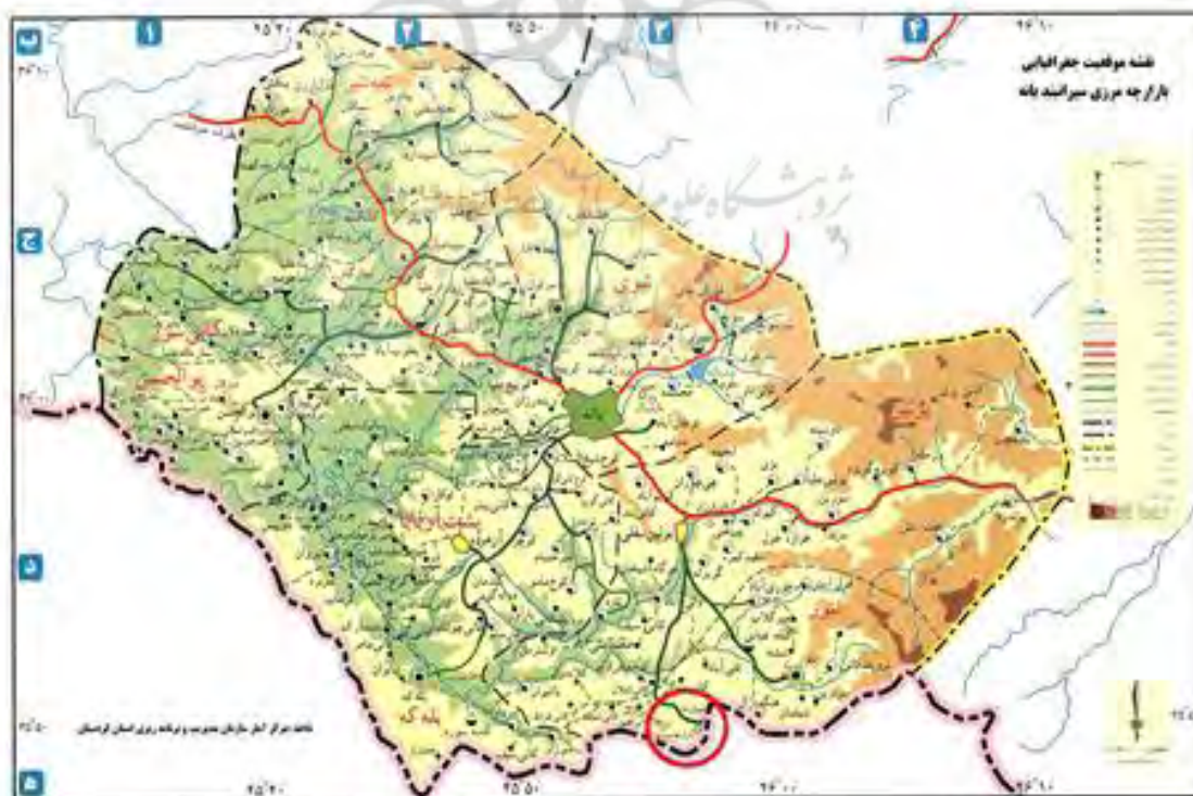
شکل ۱: موقعیت جغرافیایی محدوده مورد مطالعه در شهرستان بانه

شهر بانه در منتهی الیه مرز ایران در همسایگی با عراق در ارتفاعات رشته کوه زاگرس قرار دارد. این شهر در ارتفاع ۱۵۵۰ متر از سطح دریا واقع شده که از طرف شمال به آذربایجان غربی، از شرق به دهستان سرشیو میره‌ده سقز، از جنوب به خط الرأس ارتفاعات بین بانه و دره شلیر در کردستان عراق و از غرب به دهستان سیوهیل والان در کردستان عراق محدود می‌شود. شهر کوچک بانه در دهه اخیر در پی تحولات ملی و منطقه ای به صورت دوره ای، تاثیرات متفاوتی از مرز و بازارچه‌های مرزی پذیرفته است. بازارچه سیرانیند بانه نیز از مهمترین بازارچه مرزی کشور و دومین بازارچه مشترک مرزی استان کردستان بعد از بازارچه باشماق بوده است که برابر مصوبه هیات محترم وزیران در سال ۱۳۸۹ به عنوان مرز رسمی شناخته شد. این بازارچه در جوار روستای سیرانیند از توابع بخش نور و در جنوب شرقی شهرستان بانه واقع گردیده و با شهر سلیمانیه عراق حدود ۱۶۰ کیلومتر فاصله دارد. از لحاظ میزان حجم مبادلات و تعداد فعالان و شاغلین، رتبه دوم بازارچه‌های مرزی استان کردستان را دارد (Golchini, 2014: 83).