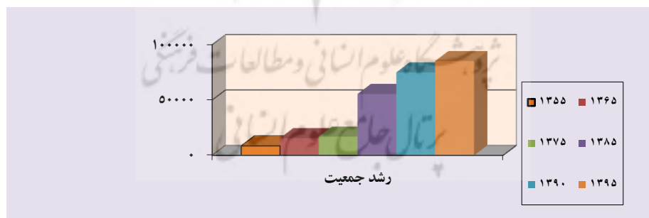
شکل ۲: رشد جمعیت دوره ۱۳۵۵-۱۳۹۵

بر اساس آخرین اطلاعات موجود شهرستان بانه براساس سرشماری سال ۱۳۹۵ با جمعیت ۱۳۲۵۶۵ نفر چهارمین شهرستان استان بوده که نرخ رشد جمعیت سالانه‌ای در حدود ۱/۰۳ درصد را دارد. همچنین در رابطه با ضریب رشد شهرنشینی، با بیش از ۶۳ درصد، رتبه سوم استان کردستان را در سال ۱۳۹۵ به خود اختصاص داده است. و به لحاظ تراکم جمعیت با ۷۶/۹ نفر در کیلومتر مربع در رتبه دوم استان قرار دارد که یکی از دلایل آن می‌تواند وجود بازارهای مرزی در بانه و مبادله با عراق می‌باشد (Statistical Yearbook, Baneh County, 1395). (شکل ۲):