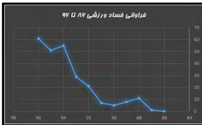
شکل ۲. روند بازتاب فساد ورزشی در رسانه‌های ایران از ۸۶ تا ۹۶

همانگونه که در شکل ۲، مشخص است، در ابتدای مسیر، روند بروز و انتشار فعالیت های مفسدانه، بیانگر شیب و نوسان کندی است که در ادامه به سرعت جای خودش را به شیبی تند و ناگهانی می دهد. این مسئله احتمالاً نشانگر این مطلب است که از یک سو ارتقاء جایگاه، نفوذ و نحوه دسترسی رسانه ها در سالهای اخیر و از سوی دیگر تغییر روح فعالیت‌های ورزشی از مواردی همچون "بازی جوانمردانه" به مواردی مانند فریب کاری و "برنده شدن به هر قیمتی"، باعث شده است روند بروز و انتشار این نوع فعالیت ها با شتاب عجیبی در حال رشد باشد.