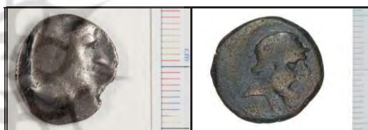
تصویر ۵- سکه‌های اشکانی منحصر به فرد با تصویر شاه به سمت راست (موزه ملک).

در اکثر سکه‌های ایران باستان رسم بر نشان دادن چهره پادشاهان از نمای روبه‌روی بوده است؛ درحالی‌که در دوره اشکانی، اکثراً، چهره امیران و پادشاهان از نمای جانبی و نیم‌رخ روی سکه‌ها حک شده‌اند. به‌طور کلی، بر روی سکه‌های اشکانی چهره واقعی فرمانروا، به‌صورت نیم‌رخ نقش گردیده است. تغییرات چهره حتی آرایش ریش و موی شانه‌ای که مدت طولانی سلطنت کرده‌اند، در تصاویر آن‌ها بر روی سکه‌ها، به‌روشنی، مشهود است. تصویر فرمانروا، به‌صورت نیم‌رخ است که اغلب، به سمت چپ و به‌ندرت، به سمت راست می‌نگرد؛ در بعضی موارد نیز تصویر پادشاه، تمام‌رخ و از روبه‌رو به نمایش گذاشته شده است (تصویر ۲). در مجموعه موزه ملک، تنها سه عدد سکه از دوره اشکانیان موجود می‌باشد؛ که در روی سکه، شاه با نگاه کردن به سمت راست تصویر شده است؛ دو عدد از آن‌ها، چهار خالکسی و متعلق به مهرداد اول یا اشک ششم (۱۳۷-۱۷۱ ق.م.)، بوده است و دیگری به خاطر عدم وضوح، قابل شناسایی نیست (تصویر ۵).