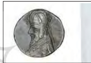
تصویر ۱- درهم نقره سنتروک اول اشکانی (موزه ملک).

واحد وزن سکه‌های برنزی، کالکوی است - که بر اساس اوزان یونانی بوده - به‌طور متوسط، دو گرم وزن داشتند و هر هشت کالکوی مسی برابر یک ابول ارزش داشت. عیار کالکوی‌های مسی نیز به‌مرور زمان پست‌تر گردید؛ به‌طوری‌که، در اواخر حکومت اشکانیان، تقریباً به نصف تنزل یافت. فقط سکه‌های ضرب سلوکیه از این قاعده مستثنی و همیشه از عیار خوبی برخوردار بوده‌اند (سرفراز و آور زمانی، ۱۳۸۹: ۲۷-۳۲).