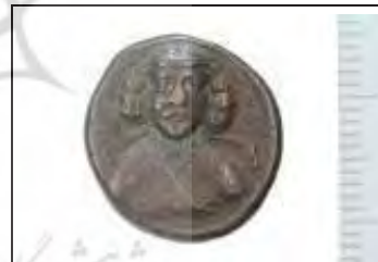
تصویر ۲- دو خالکسی مس فرهاد سوم اشکانی (موزه ملک).

اغلب سکه‌های اشکانی دارای علایمی مانند ماه و خورشید هستند که بیانگر این نکته است که شاه، خود را پسر ماه و خورشید می‌داند. احتمالاً تعدادی از این علایم نشان‌دهنده محل ضرب سکه باشد.