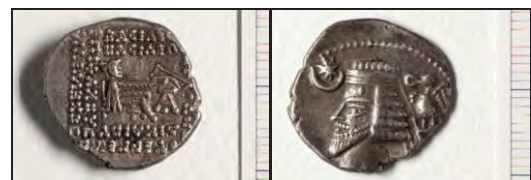
تصویر ۸- درهم فرهاد چهارم (موزه ملک).

هنرمندان طراح سکه‌های اشکانی، تا حد امکان، در بازسازی چهره امیران و شاهان به رئالیسم و واقع‌گرایی پای‌بند بوده‌اند؛ چنان‌که در بعضی از دوره‌ها، حتی خال گوشتی روی گونه یا پیشانی شاه را نیز حک کرده‌اند؛ به‌عنوان مثال، در اکثر سکه‌های چهار درهمی متعلق به فرهاد چهارم یا اشک چهاردهم (۲-۳۷ ق.م.)، روی چهره پادشاه خال گوشتی دیده می‌شود (تصویر ۸).