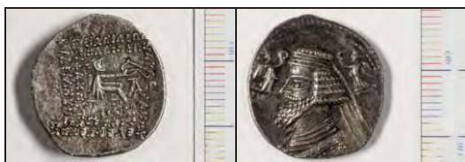
تصویر ۴- درهم نقره فرهاد پنجم (موزه ملک).