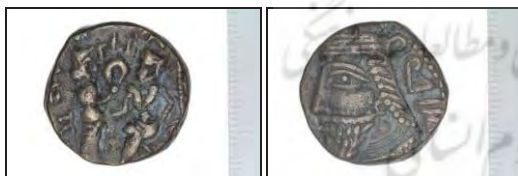
تصویر ۹- چهار درهمی بلاش پنجم (موزه ملک).

این تصاویر، شامل الهه‌های گوناگون و حیوانات و گیاهانی هستند که اغلب، مظاهر الهه‌ها محسوب می‌شوند؛ اما در بعضی موارد نیز گیاهان و حیوانات واقعی به تصویر کشیده شده‌اند که مردم بعضی نواحی، به پرورش و داشتن آن‌ها مباحثات می‌کرده‌اند؛ مانند نقش اسب و خوشه گندم و خرما و انگور و... هم‌چنین، نقش ماه، خورشید و ستاره است. علامت‌های دیگر نیز به شکل منوگرام در پشت بعضی سکه‌ها دیده می‌شود که از معنی و مفهوم آن، هنوز اطلاع درستی در دست نیست (تصویر ۹).