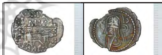
تصویر ۷- درهم نقره بلاش پنجم (موزه ملک).

هنرمندان طراح سکه‌های اشکانی، تا حد امکان، در بازسازی چهره امیران و شاهان به رئالیسم و واقع‌گرایی پای‌بند بوده‌اند؛ چنان‌که در بعضی از دوره‌ها، حتی خال گوشتی روی گونه یا پیشانی شاه را نیز حک کرده‌اند؛ به‌عنوان مثال، در اکثر سکه‌های چهار درهمی متعلق به فرهاد چهارم یا اشک چهاردهم (۲-۳۷ ق.م.)، روی چهره پادشاه خال گوشتی دیده می‌شود (تصویر ۸).