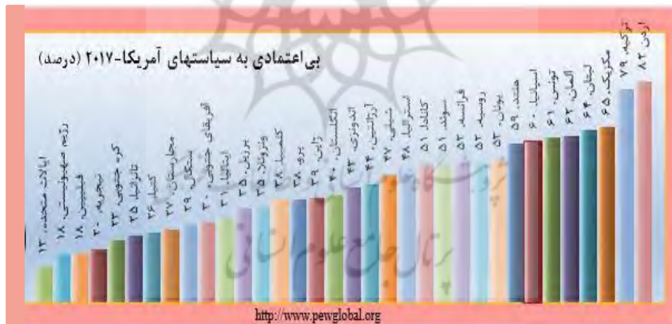
نمودار (۱): نظرسنجی پیو در باب بی‌اعتمادی به سیاست‌های آمریکا منبع: (موسسه تحقیقاتی پیو)

منطقه زمینه مساعدی برای گسترش روابط بین دولت‌های چپ‌گرای کوبا، ونزوئلا، بولیوی، اکوادور و نیکاراگوئه و سایر دولت‌های امریکای لاتین را با ایران فراهم کرده است. چنین موقعیتی موجب شد تا ایران بر خلاف میل آمریکا، با استفاده از احساسات ضد نظام سلطه و به طور خاص روحیه ضد آمریکایی و همچنین بی‌اعتمادی که به سیاست‌های آمریکا در بین بسیاری از دولت‌ها و ملت‌های امریکای لاتین وجود داشته است، در حیات خلوت ایالات متحده حضور یابد و به گسترش نفوذ و قدرت بازیگری پردازد. طبق نظرسنجی که موسسه تحقیقاتی «پیو» در سال ۲۰۱۷ انجام داده است (نمودار شماره ۱) مخالفت با سیاست‌های آمریکا نه تنها در ونزوئلا و کوبا بلکه در دیگر کشورهای امریکای لاتین از جمله برزیل، کلمبیا، پرو، شیلی، مکزیک و آرژانتین هم مشاهده می‌شود. به‌طور کلی آرژانتینی‌ها در قرن ۲۱ تنها ۴۰ درصد به سیاست‌های آمریکا اعتماد داشته‌اند.