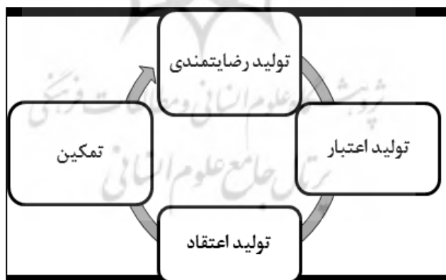
شکل (۱): فرایند قدرت نرم

قدرت نرم، متکی بر ارزش‌های مشترک است و نتایج به‌کارگیری آن، تولید رضایت‌مندی، اعتقاد، اعتبار و تمکین به‌دست می‌آید. فرایند این نتایج را می‌توان چرخه تولید و بازتولید قدرت نرم نامید (یوسفی، ۱۳۹۷).