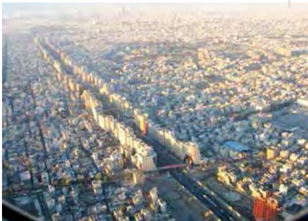
تصویر ۲. گسست فضایی شکل‌گرفته به واسطه احداث پروژه بزرگراه نواب.

• محله و سکونت: مسکن مهر و پروژه نواب همچون نمادهایی از عدم انعطاف‌پذیری، بی‌هویتی و گسست اجتماعی شهرهای ما باید سکونتگاه‌هایی در خور دموکراسی و پایداری اجتماعی برای شهروندان فراهم کنند. در حالی که بدون شک، در بسیاری از موارد اجتماعات محلی ما، به واسطه فقدان ارزش‌های دموکراتیک و اصول حیاتی مربوط به مسئله مسکن، در حال زوال هستند. بدین‌سان، نمونه‌های فاجعه‌بار بسیاری همچون مسکن مهر و پروژه بزرگراه نواب بر ناکارآمدی سیاست‌های شهری ایران صحنه می‌گذارند. از سال ۱۳۸۶ ه.ش.، پروژه‌های محدودی در ارتباط با ساخت مسکن اجتماعی برای طبقه متوسط و کم‌درآمد ایرانی اجرا شده است. این پروژه‌ها به دنبال تحقق اهدافی همچون کاهش قیمت زمین، جلوگیری از پراکنده‌روی و حاشیه‌نشینی و ارتقای عدالت اجتماعی و کیفیت‌های محیطی بودند که هیچ یک از آنها عملی نشد (خلیلی، نورالهی، رشیدی و رحمانی، ۱۳۹۳، ۸۴). در واقع مجتمع‌های مهر، اغلب در حومه و در اشکال غیرمنعطف و تنها با تأکید بر کاربری مسکونی ساخته می‌شوند. ماهیت این پروژه‌ها عوام‌گرایانه است و مسئولین با صرف‌نظر از تصمیم‌گیری عمومی و مسئله عدالت، تنها از مشارکت و حمایت مالی مردم سوءاستفاده می‌کنند. این‌گونه پروژه‌ها کمترین تناسب و انطباق را با سایر برنامه‌ها و پروژه‌های شهری دارند و همچنین بر بازار مسکن اثر سوء می‌گذارند؛ در واقع در پس پرده این پروژه‌ها، مطالعات اجتماعی و اقتصادی مناسب و بسنده‌ای صورت نمی‌گیرد (Barzegaran & Daroudi, 2015). پس از مصاحبه با افراد محلی، آنها از نبود جذابیت و خدمات و هویت محیطی مناسب شکایت کردند. همچنین در زمینه حیات جمعی،