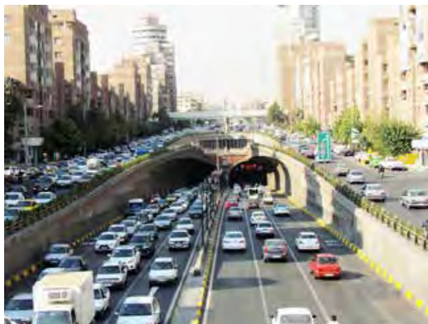
تصویر ۳. بزرگراه نواب به عنوان یک طرح کاملاً تمامیت‌خواه.