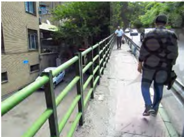
تصویر ۶. نمونه‌ای از ساختار غیرهمه‌شمول پیاده‌رو با شیب زیاد، عرض کم و کف‌سازی نامناسب.

به عنوان مثال، پروژه صدر در شهر تهران یکی از نمونه‌هایی است که به‌وضوح به نمادی از معضل مذکور بدل شده است. شهردار تهران تصمیم گرفت تا طبقه‌ای دیگر بر روی بزرگراه صدر (به صورت یک روگذر) احداث نماید (تصویر ۸)؛ متأسفانه این پروژه بدون در نظر گرفتن ترجیحات شهروندان و ارزش‌های انسانی طی رویه‌ای فن‌سالارانه به اجرا درآمد. این تصمیم نه‌تنها حلال مشکلات ترافیکی نبوده، بلکه حتی دموکراسی شهری و دخالت‌های مدنی را نیز زیر سؤال برده است. در واقع اقدامات شهری بی‌شک باید جهت‌گیری پیاده‌مدارانه داشته باشند تا به نوعی بر دموکراسی شهری تأکید شود. همچنین، آن دسته از پروژه‌های انگشت‌شمار کشورمان هم که در راستای