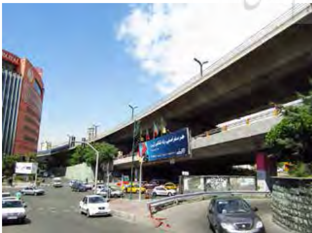
تصویر ۸. ساختار غیرانسانی، آبرسازهای و فن‌سالارانه بزرگراه دوطبقه صدر.