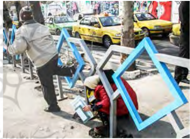
تصویر ۵. عدم تمایل به استفاده از زیرگذر.