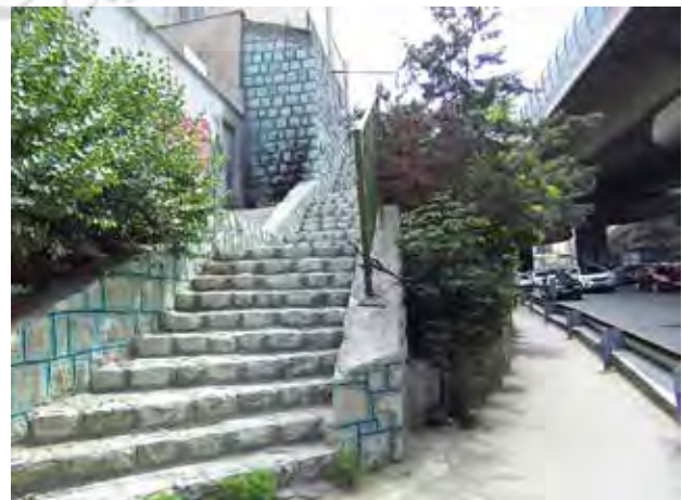
تصویر ۷. نقض حقوق افراد ناتوان جسمی به واسطه ساختار پلکانی غیرهمه‌شمول.