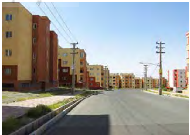
تصویر ۱. مجتمع مسکونی مهر همچون تجمعی از آجر و پنجره.