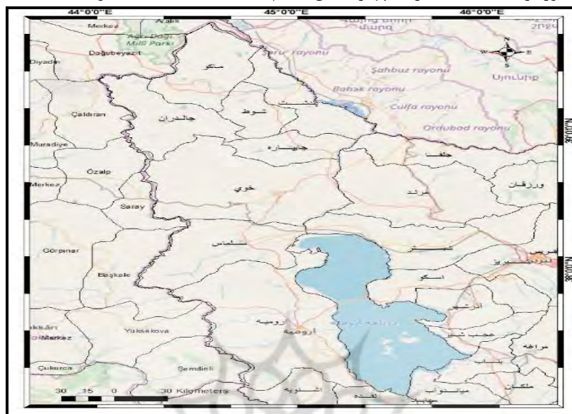
شکل ۱- استان آذربایجان غربی و استان های شرقی کشور ترکیه دارای مرز مشترک با کشور ایران

مساحت منطقه موردنظر مطالعه (دو بخش ایران و ترکیه)، حدود ۹۲۷۰۰ کیلومترمربع است. منطقه موردنظر مطالعه حاضر مانند جزیره ای است که توسط دو دریاچه وان (در کشور ترکیه) و دریاچه ارومیه (در کشور ایران) احاطه شده است. مناطق موردنظر این مطالعه با توجه به دارا بودن پیشینه های تاریخی و حتی مشترک، پتانسیل های اکو توریسم و گردشگری و سایر منابع و پتانسیل های جغرافیایی می توانند در توسعه و پیشرفت های همدیگر در آینده بسیار مؤثر باشند. منطقه موردنظر این مطالعه بخشی از شرق کشور ترکیه است که دارای چهار استان به نام های Van, A r . I d و Hakkari است. (شکل ۱).