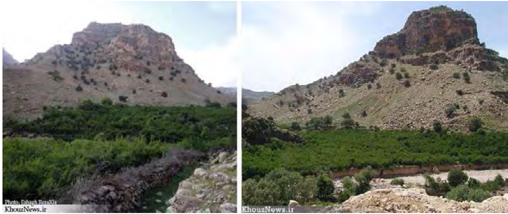
تصویر ۴. چشم‌انداز کوه دز واقع در منطقه منگره که قلعه منگره بر فراز آن واقع شده است.

شرقی شش مخزن برای ذخیره آب کنده شده و دیوار آن‌ها با سنگ و ملات آن با نوعی ساروج ساخته شده است (تصویر ۵).