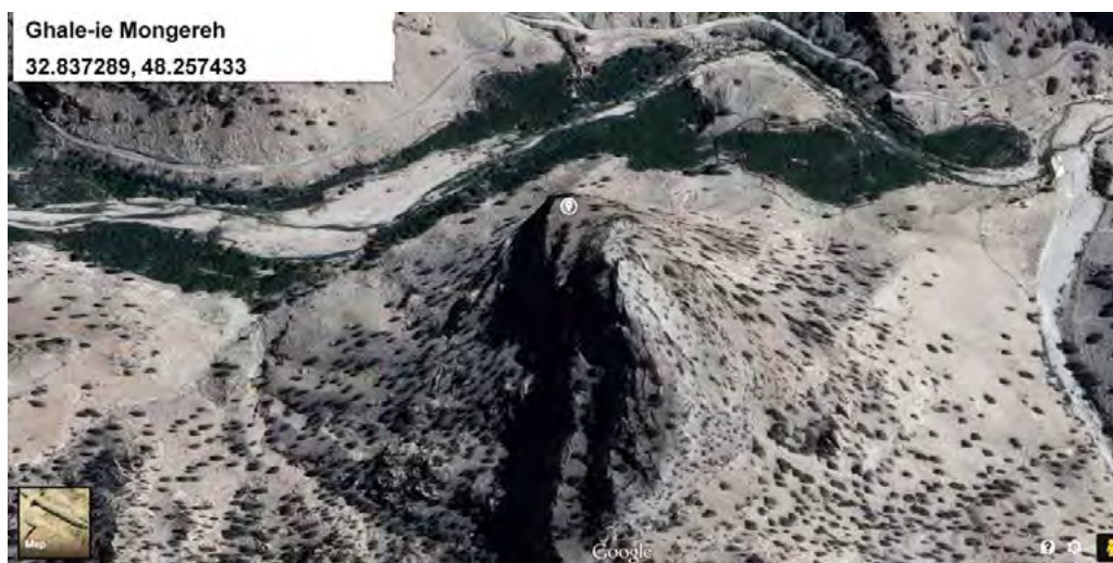
تصویر ۳. موقعیت جغرافیایی قلعه منگره برفراز قله دز (www.google.com/maps).

براساس اسناد موجود، قلعه منگره می‌تواند ادامه بسط و گسترش قدرت اسماعیلیان در دیگر کوهستان‌های ایران باشد.