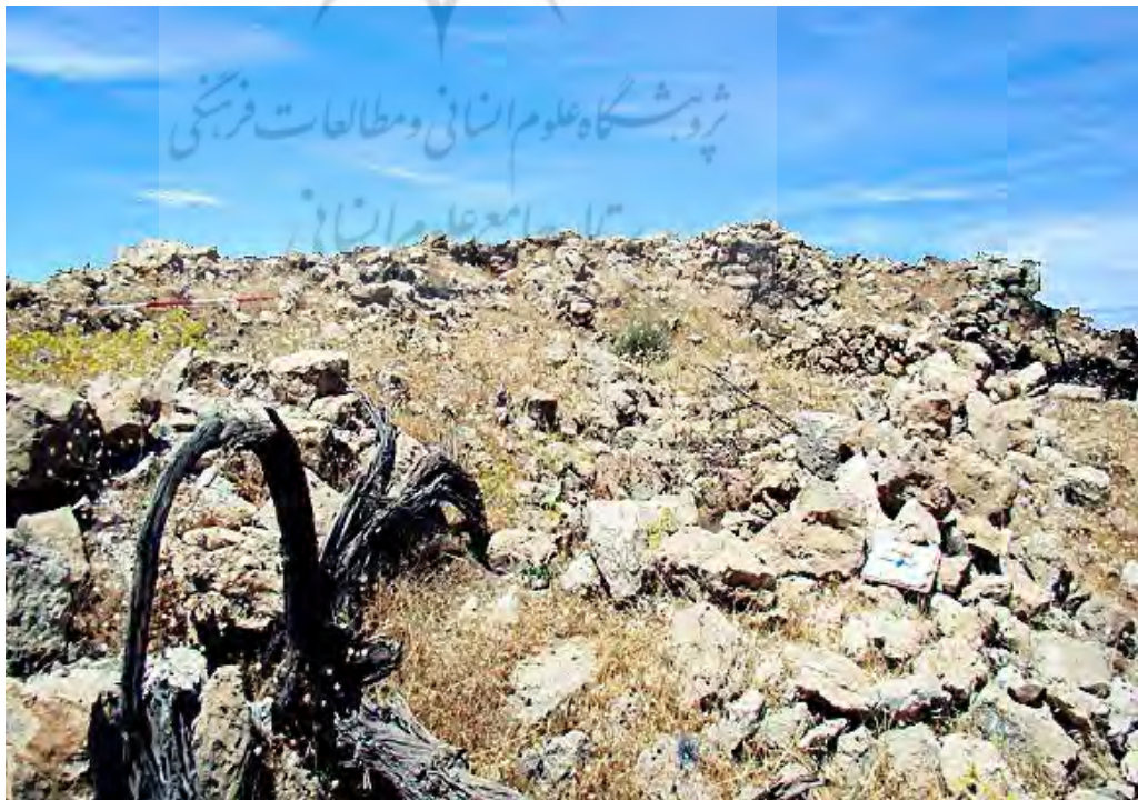
تصویر ۵. ویرانه‌های قلعه منگره (گزارش انجمن میراث فرهنگی اندیمشک).

دیدگاه قلعه طوری است که دشت شرقی که اینک با ایجاد سد دز آن را آب فرا گرفته به خوبی نمایان است. در کنار قله دز دره منگره قرار دارد و در نقطه‌ای به نام گرداب حجم زیادی از آب از عمق زمین خارج می‌شود و به دره می‌ریزد. آنچه که در آنجا به چشم می‌آید وجود آسیاب و مقابر است. بر اساس معماری و مصالح به کار رفته در آسیاب‌ها، قدمت آن‌ها به دوره ایلیخانان می‌رسد. آنچه مسلم است قلعه منگره که از نظر نظامی اهمیت ویژه‌ای داشته و همواره در آن برهه از تاریخ بر سر آن کشمکش و درگیری رخ داده، در یکی از مهم‌ترین دوران حیات خود در دست اسماعیلیان بوده است. نگارندگان معتقدند زمانی که پایان عمر اسماعیلیان به دست ایلیخانان رقم