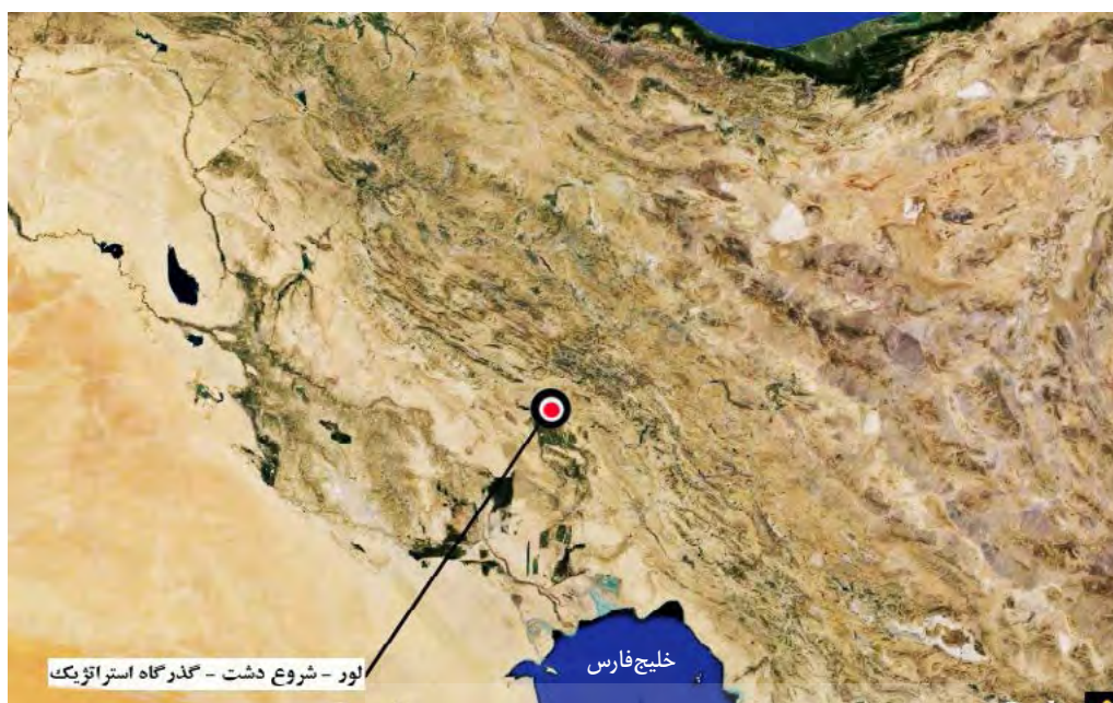
تصویر ۱. دشت لور.

قرار دارد. این جاده از عصر باستان نیز وجود داشته و آشوربنی پال در لوحه خود آورده است که: سربازان من در محلی که رودخانه کرخه وارد دشت می‌شد، از این رود عبور کردند (رو، ۱۳۸۱: ۳۶۹) و تمدن ایلام باستان را نابود کردند. این سند نشان می‌دهد که از دیرباز گذرگاه فوق وجود داشته است.